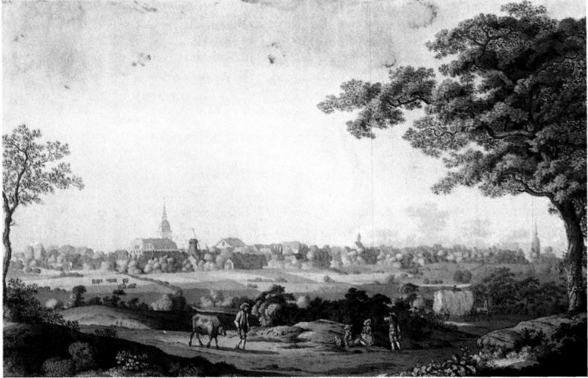
Ansicht der Stadt Oldenburg von Nordosten, kolorierte Aquatintaradierung von J.M. Bürmann, um 1800.

Abb. auf der Titelseite: Oldenburg, Blick durch das Heiligengeisttor in die Lange Straße mit Lappan, kolorierte Umrißradierung von G.F.F. David, 1820.