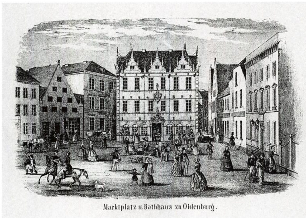
Marktplatz u. Rathhaus zu Oldenburg.

Nachdem Vermöege des in Curia am 13 Decemb: 1740 Abgehaltenen protocoll resolviret und beschlofen worden, dafl hin künfftig des Sonnabendts zu der wöchentlichen Samlung des Armen Geldes, ledieglich die Neu angehende(n) Bürger, solchergestaldt gezogen werden sollen, dafl so woll die Bürger Söhne als andere Frembde, in der Reyhe und Ordnung, wie Sie den Bürger Eydt abgestattet haben, ohne unterscheidt und zwar ein jeder Ein halb Jahr solche Samlung Verrichten, Auch gleich Nach Neujahr 1741. Von denen jeniegen welche in diesem 1740ten Jahre sothanen Bürger Eydt abgestattet, der Anfang gemacht werden solle; als sindt solche neue angehende Bürger, in der Ordnung, wie sie den Bürger Eydt abgestattet haben, in diesem Buche zur Nachricht notiret worden.