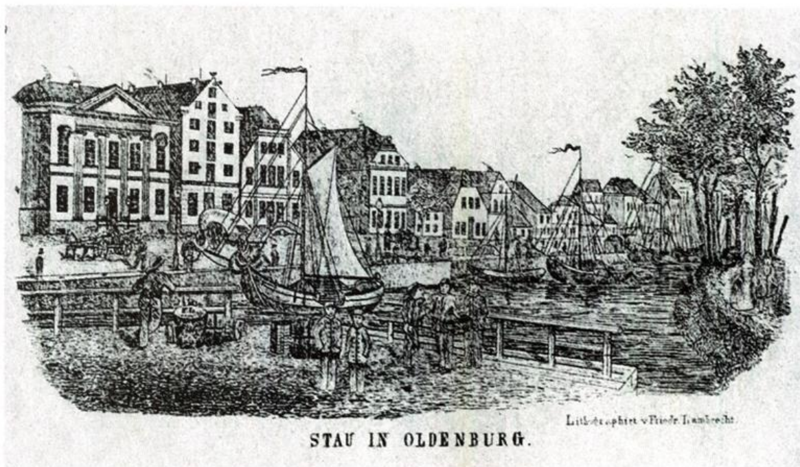
Abb. 2: Der Stau (alter Hafen) in Oldenburg, Lithographie von Friedrich Lambrecht, auf Briefbogen um 1850.

Schon nach der Wiener Schlussakte (Art. 18) vom 15. Mai 1820 war dem Einzelnen Freizügigkeit in allen Bundesstaaten eingeräumt worden. Aber erst das Gesetz des Norddeutschen Bundes über die Freizügigkeit von 1867 sorgte für das Erlöschen der Verleihung des Bürgerrechts.