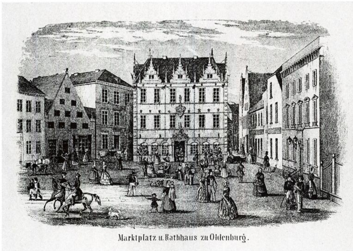
Marktplatz u. Rathhaus zu Oldenburg.

Nachdem Vermöege des in Curia am 13 Decemb: 1740 Abgehaltenen protocoll resolviret und beschlofen worden, dafl hin künfftig des Sonnabendts zu der wöchentlichen Samlung des Armen Geldes, ledieglich die Neu angehende(n) Bürger, solchergestaldt gezogen werden sollen, dafl so woll die Bürger Söhne als andere Frembde, in der Reyhe und Ordnung, wie Sie den Bürger Eydt abgestattet haben, ohne unterscheidt und zwar ein jeder Ein halb Jahr solche Samlung Verrichten, Auch gleich Nach Neujahr 1741. Von denen jeniegen welche in diesem 1740ten Jahre sothanen Bürger Eydt abgestattet, der Anfang gemacht werden solle; als sindt solche neue angehende Bürger, in der Ordnung, wie sie den Bürger Eydt abgestattet haben, in diesem Buche zur Nachricht notiret worden.