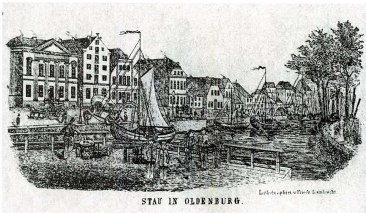
Abb. 2: Der Stau (alter Hafen) in Oldenburg, Lithographie von Friedrich Lambrecht, auf Briefbogen um 1850.

Schon nach der Wiener Schlussakte (Art. 18) vom 15. Mai 1820 war dem Einzelnen Freizügigkeit in allen Bundesstaaten eingeräumt worden. Aber erst das Gesetz des Norddeutschen Bundes über die Freizügigkeit von 1867 sorgte für das Erlöschen der Verleihung des Bürgerrechts.