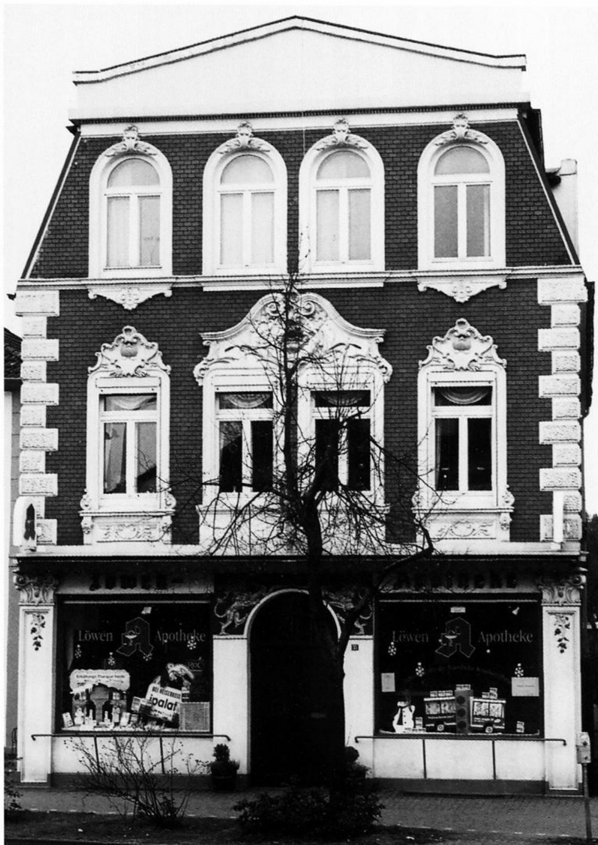
Abb. 2: Die Löwen-Apotheke im Jahre 2001.