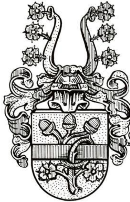
(57) Reiners, Oetken