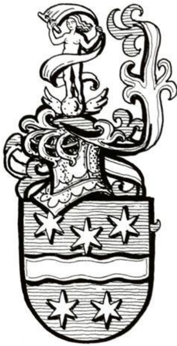
(39) von Thünen