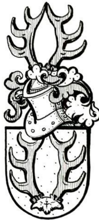
(22) von Lindern

(21) Kückens : Stedinger Geschlecht, das auch dem oldenburgischen Adel (1268) und der Bremer Bürgerschaft (1396) angehörte und seit 1498 auf dem Stammhof zu Hiddigwarden bei Berne nachweisbar ist. Albert Kückens begründete 1610 die Elsflether Linie.