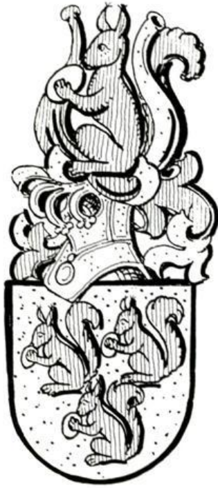
(1) von Aschwege