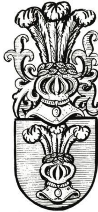
(36) von Seggern

(35) Schauenburg : Seit 1624 in der Stadt Oldenburg nachweisbare Familie. Wappen (um 1850): Von Silber vor Blau gespalten, vorn ein, hinten zwei pfahlweise gestellte, zunehmende Halbmonde in gewechselten Farben; auf dem blau-silbern bewulsteten Helm mit gleicher Decke ein mit einem zunehmenden silbernen Mond belegter geschlossener blauer Flug. Quellen : Deutsches Geschlechterbuch, Bd. 122, Glücksburg 1957.