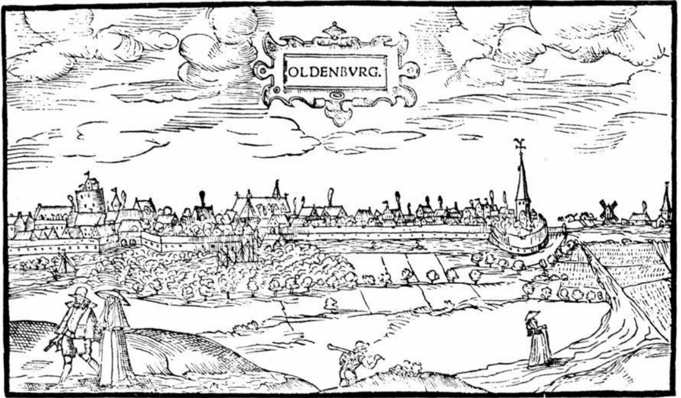
Oldenburg im Jahre 1599, Blick von Donnerschwee