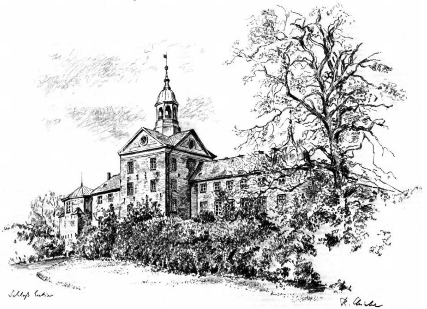
Abb. 4: Das Schloß in Eutin; Zeichnung von Reinhold Liebe, Süsel.