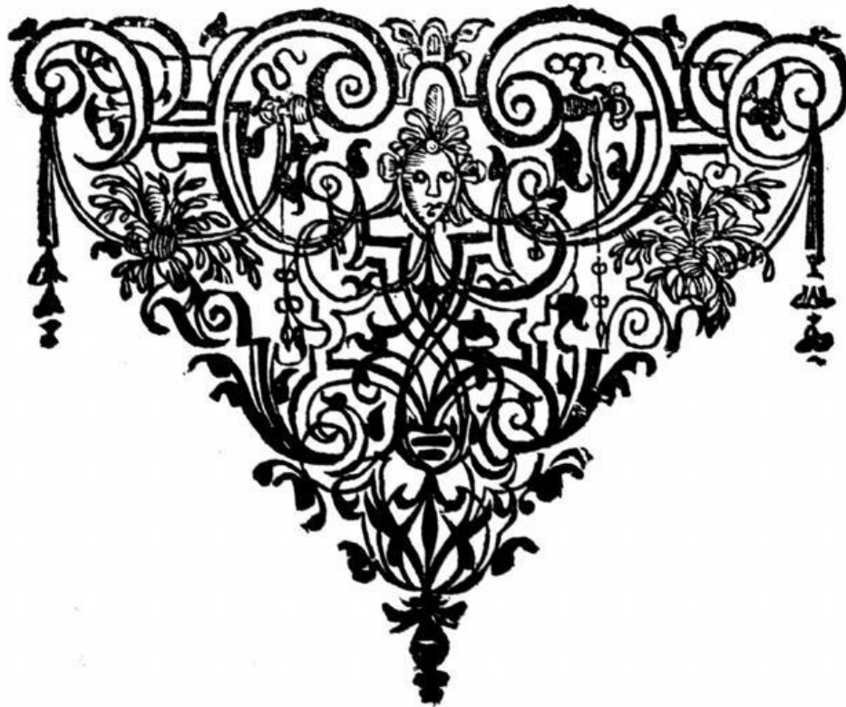
(1664 in Oldenburg gedruckte Vignette)