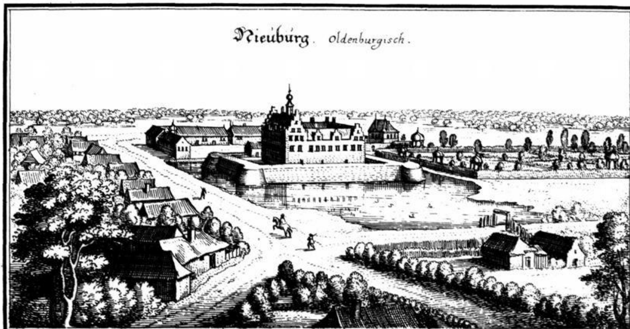
Neuenburg (Merian 1649)