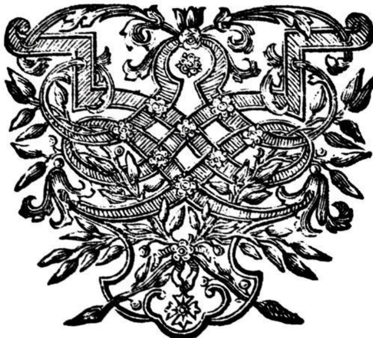
Vignette von 1756