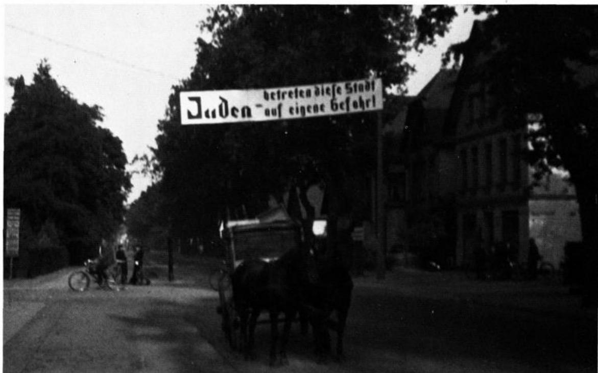
Abb. 28: Spruchband über der Oldenburger Straße in Delmenhorst (ca. 1935). So wurde das alte Ehepaar Alexander begrüßt, wenn es seine Verwandten in Delmenhorst besuchte.