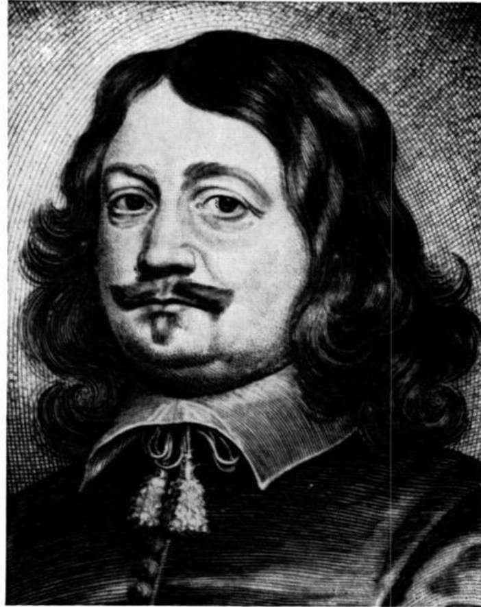
Hermann Mylius (1603 – 1657)