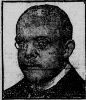
Dr. Marx vom Zentrum.

Der Reichspräsident hat heute vormittag den bisherigen Reichstagsmarsch mit der Regierungsbildung beauftragt. Der Abgeordnete Marx hat den Auftrag angenommen.