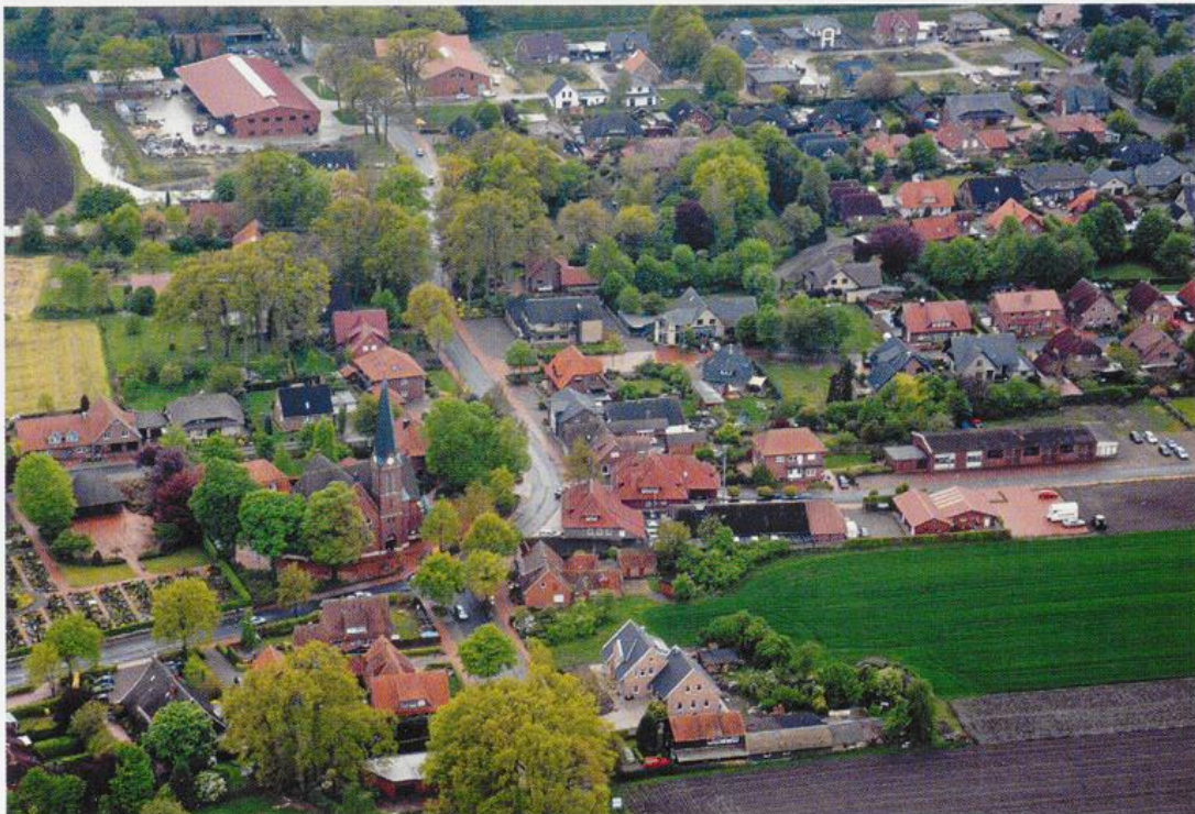
Abb. 6: Bevern aus der Vogelperspektive (Ausschnitt)

Als vorteilhaft für das Verkehrswesen erweist sich bis in die Gegenwart die bereits im letzten Drittel des 19. Jahrhunderts erfolgte Anbindung der Gemeinde Essen an die Bahnlinie Wilhelmshaven-Osnabrück mit einer eigenen Bahnstation. 42