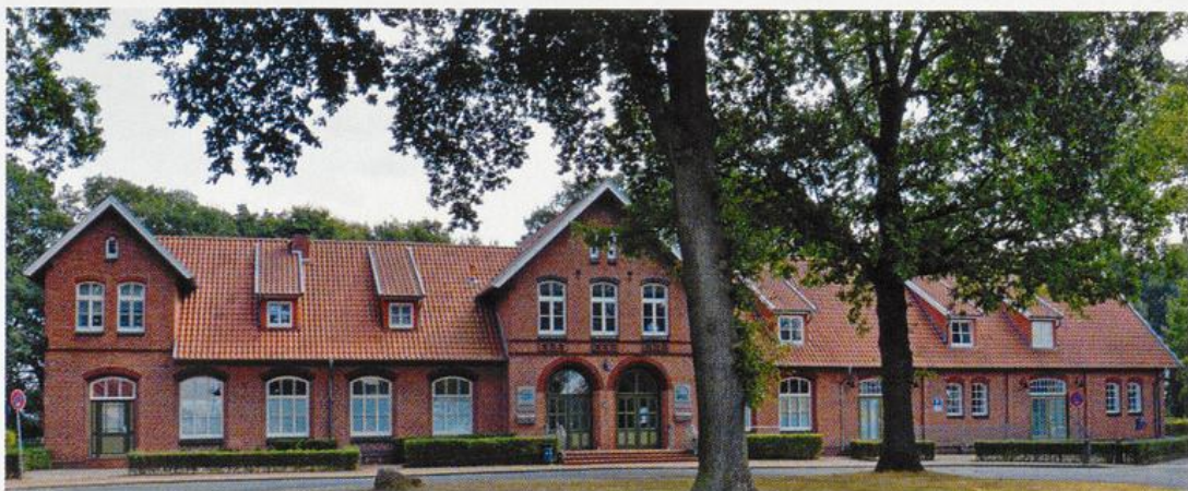
Abb. 4: Bahnhof Essen/Oldb.

Wenngleich die Gemeinde Essen während des Ersten Weltkrieges keinen direkten Kriegshandlungen ausgesetzt war, bekam die auch vor Ort zunächst von der allgemeinen Kriegsbegeisterung ergriffene Bevölkerung, welche die aus der Gemeinde stammenden Soldaten am Bahnhof Essen in den Krieg verabschiedet hatte, 31 bald an der „Heimatfront“ die Auswirkungen des Krieges aufgrund der staatlichen gelenkten Zwangswirtschaft deutlich zu spüren, die ihren Ausdruck in einem zunehmenden Mangel an Futtermitteln und Lebensmittelknappheit fand. Der Höhepunkt der zunehmend katastrophalen Versorgungslage war im sog. „Steckrübenwinter“ von 1916/1917 erreicht als auch in der Gemeinde Essen Grundnahrungsmittel wie etwa Kartoffeln kaum noch zu bekommen waren und in steigendem Maße auf die Steckrübe zurückgegriffen werden musste. Dennoch scheint die Versorgungslage