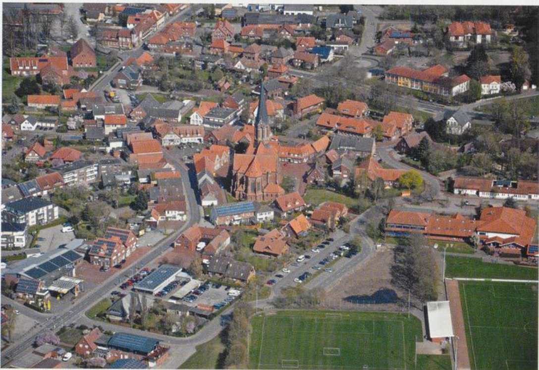
Abb. 7: Essen aus der Vogelperspektive (Ausschnitt)

Im Rahmen des vom Land Niedersachsen zur Stärkung des ländlichen Raumes geförderten „Dorfentwicklungsprogrammes“ veranlassete die Gemeinde Essen zunächst die längst überfällige Sanierung der Wilhelmstraße. Um das Erscheinungsbild des Ortes zu verbessern, sind unter der Voraussetzung der Bereitstellung finanzieller Mittel durch das Land Niedersachsen Maßnahmen zur Dorfentwicklung für die Schulstraße und Teile der August-Meyer-Straße geplant. 44