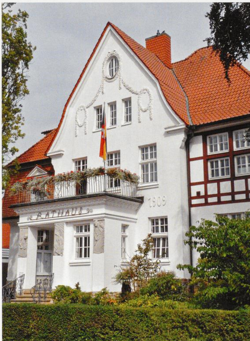
Abb. 5: Rathaus „Villa Meyer“