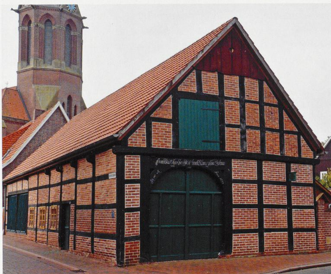
Abb. 3: Heimathaus „Brands Scheune“

Neben der Landwirtschaft und einer wachsenden Zahl kleinerer Handwerks- und Gewerbebetriebe entwickelte sich im 19. Jahrhundert aufgrund einer weit verbreiteten Verarbeitung von Wolle zu Strickerzeugnissen, die vor allem nach Holland exportiert wurden, ein proto-industrieller Gewerbebezweig. Ein Vorläufer der heute in der Gemeinde Essen verbreiteten industriellen Produktion von Fleischerzeugnissen war die Schinkenräucherei Brand. Gewerblicher Schwerpunkt der Kaufmannsfamilie Brand war zunächst der Handel und die Herstellung von Manufakturwaren, bevor sich in der zweiten Hälfte des 19. Jahrhunderts der Export von Schinken nach England als einträgliches Geschäft