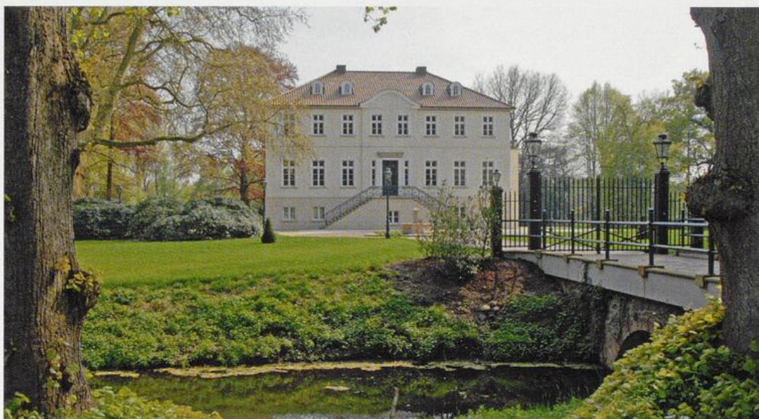
Abb. 2: Gut Lage