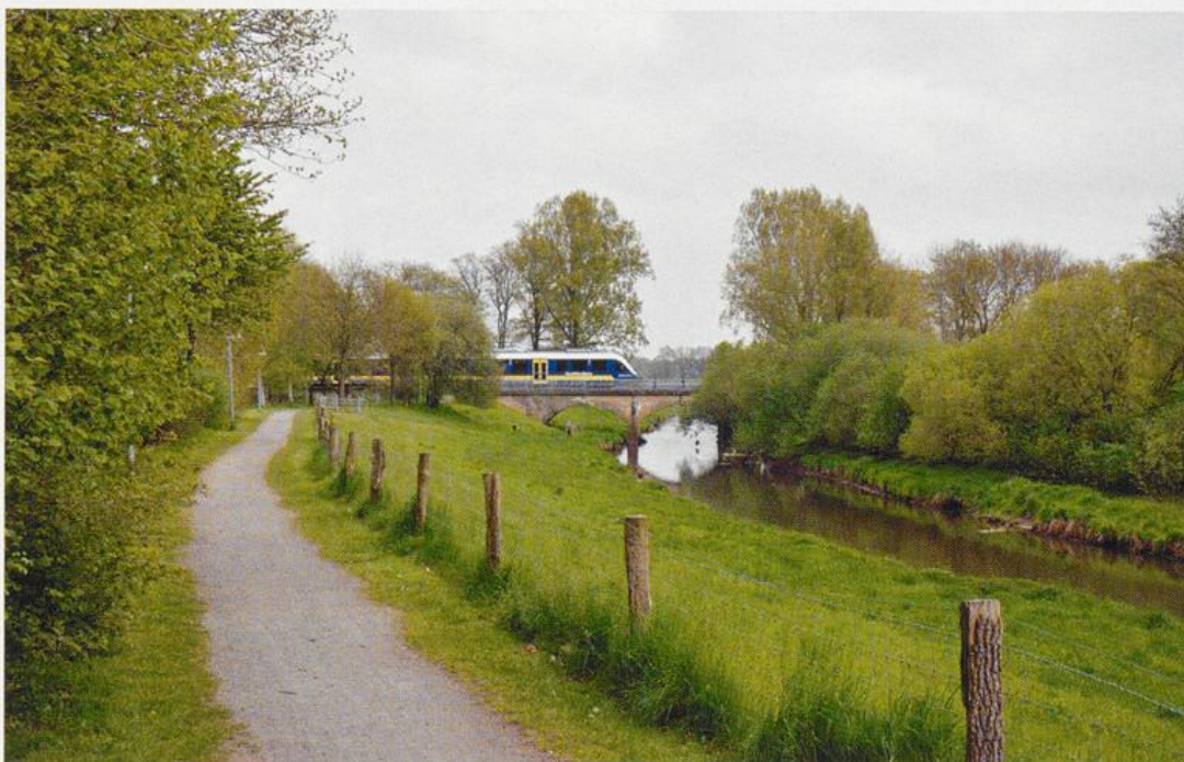
Abb. 8: Erholungsgebiet „Hasetal“

Das Solebad, neun Sportplätze, drei Turnhallen, eine Tennishalle, mehrere Reithallen und ein Trimm-Dich-Pfad treffen auf eine große Resonanz bei sport- und fitnessbegeisterten Einwohnern. Als eine im „Erholungsgebiet Hasetal“ (Abb. 8) liegende Kommune, die mit den benachbarten Landkreisen Osnabrück und Emsland durch ein ausgebauten und ausgeschildertes Netz für den Fahrradtourismus verbunden ist, richtet sich das Freizeitangebot der Gemeinde zugleich an überregionale Adressaten. Daneben eröffnet der Jugendzeltplatz an der Hase weitere touristische Möglichkeiten und erfreut sich als eine den Ansprüchen der Gegenwart gerecht werdende Einrichtung hoher Beliebtheit bei Einzelreisenden, Freizeitgruppen oder Schulklassen.