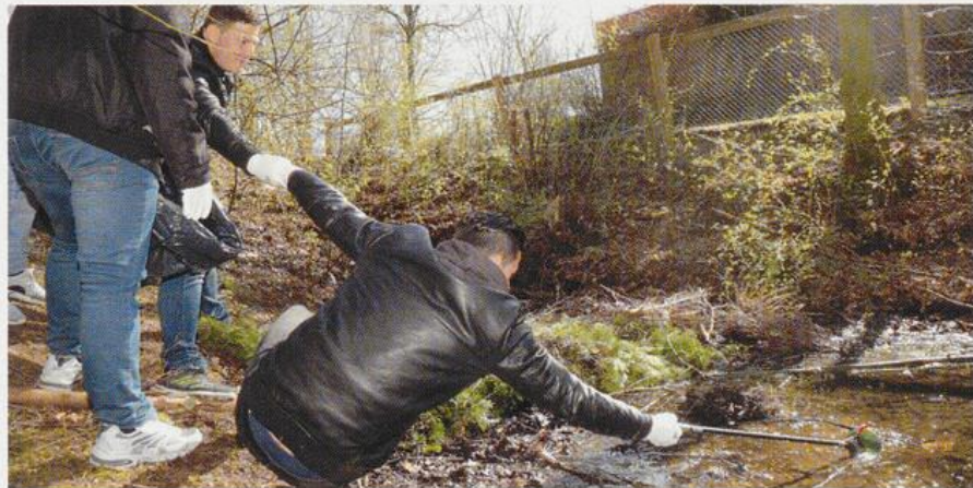
Reinigungsaktion „Cloppenburg putz(t) munter“