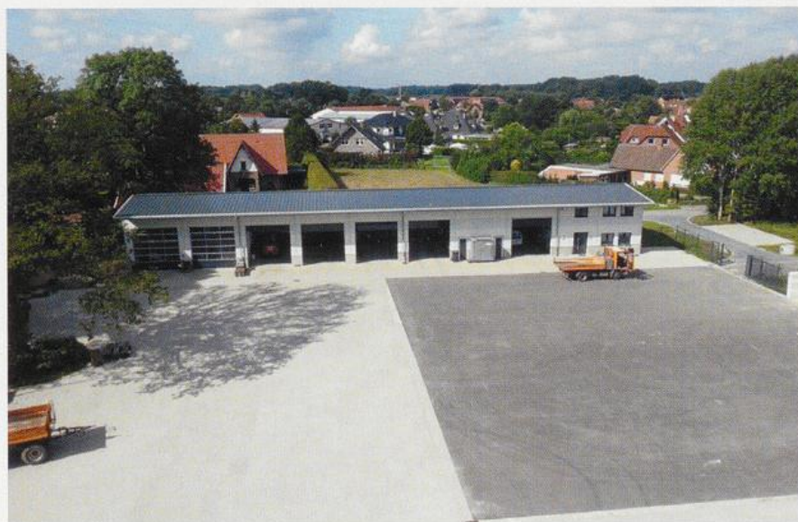
Der neue Bauhof der Gemeinde Cappeln