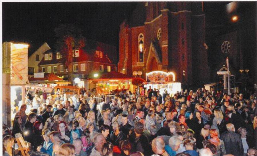
Eisenfest 2016 – Die neue Bühne in der Stadtmitte wird sehr gut angenommen