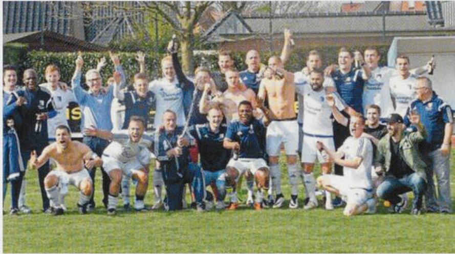
1. Herren BV ESSEN