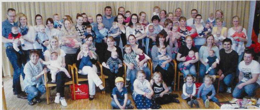
4. „Willkommenstag“ für junge Familien in Barßel am 31.03.17