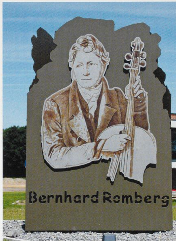
Skulptur des Cellisten und Komponisten Bernhard Romberg (geboren 13.11.1767 in Dinklage). Es wurden insgesamt drei Skulpturen von Bernhard Romberg auf dem neuen Kreisel an der Märschendorfer Straße errichtet