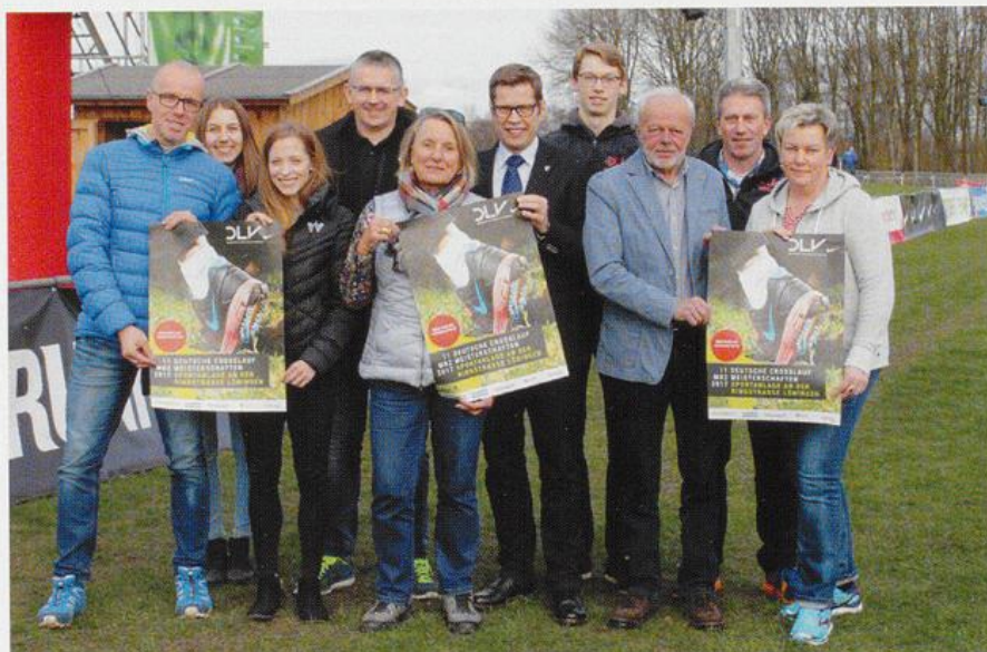
Der VfL Löningen hat 11.03.2017 bereits zum dritten Mal eine offizielle Deutsche Meisterschaft des Deutschen Leichtathletikverbandes (DLV) im Cross-Lauf veranstaltet.