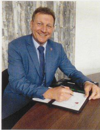
Bürgermeister Heiner Kreßmann