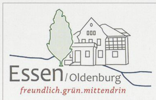
Logo der Gemeinde Essen