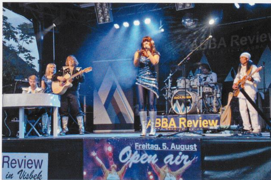
Die Gruppe „Abba Review“