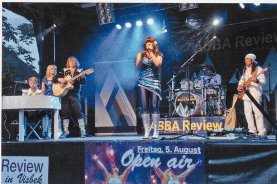
Die Gruppe „Abba Review“