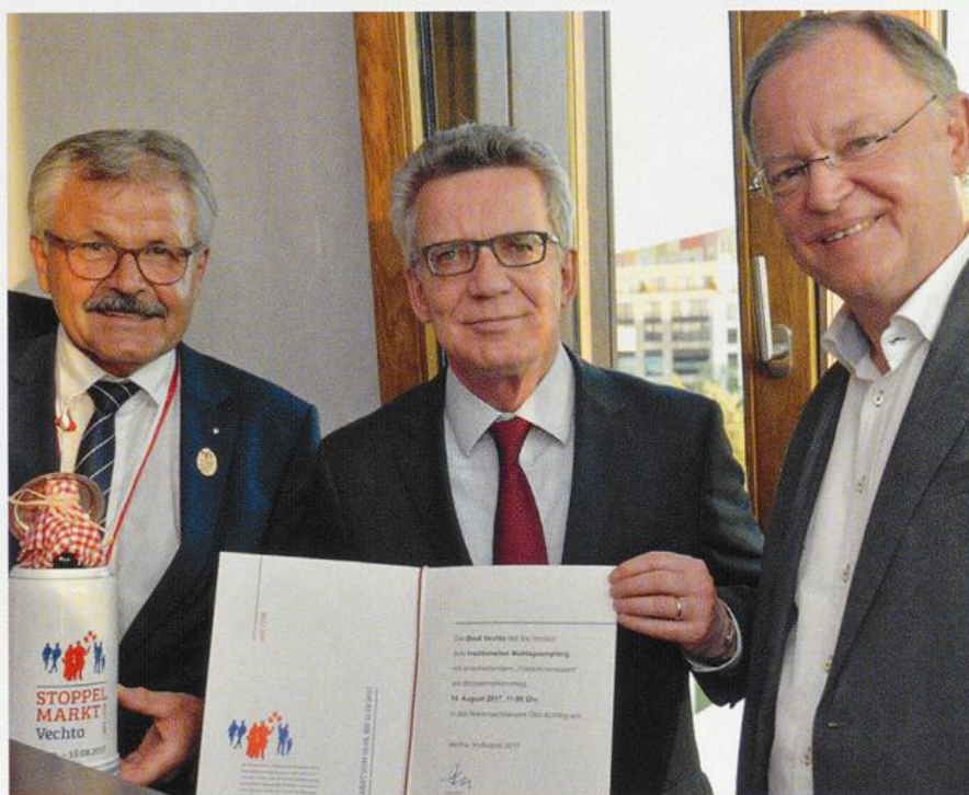
Bundesinnenminister Thomas de Maizière erhält die Einladung für den traditionellen Montagsempfang des Stoppelmarkts