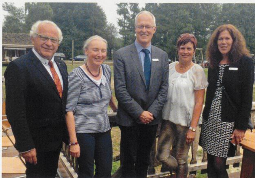
25 Jahre NIZ