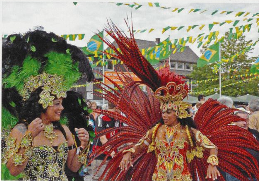
Brasilianisches Flair herrschte im Sommer 2016 in der Lohner Innenstadt.