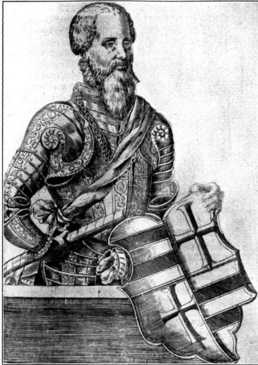
Abb. 3. Graf Anton I. von Oldenburg, 1529—73, begünstigt die Reformation und zieht die Kirchengüter ein. S. 6.