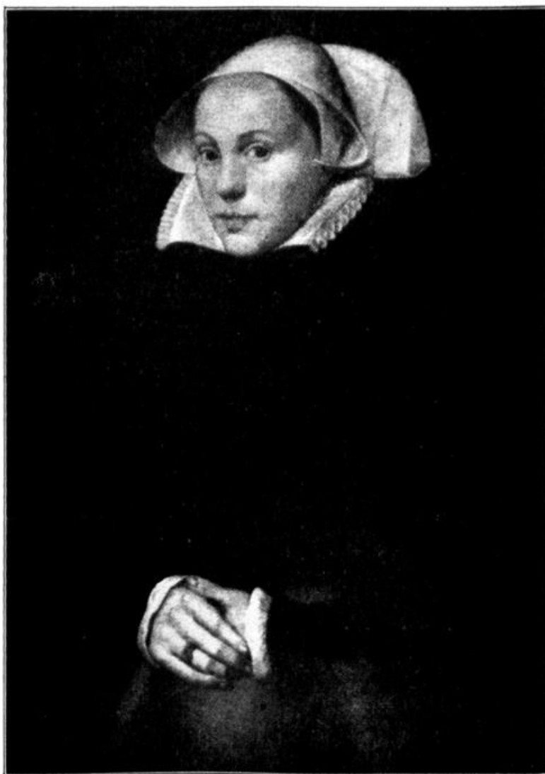
Abb. 7a. Frä. Maria von Jever aus Jahrb. 1916/17. Führte 1532 die Reformation im Jeverlande ein. § 9.