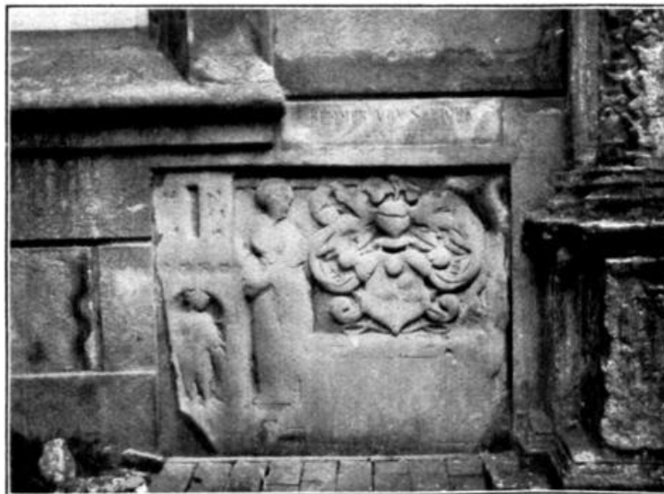
Abb. 7b. Remmer von Seediek, Rentmeister Fräulein Marias von Jever, † 1557, begünstigt die Reformation und verschont einen Teil der Kirchengüter. Sein Wappen an der Kirche zu Jever. S. 9.