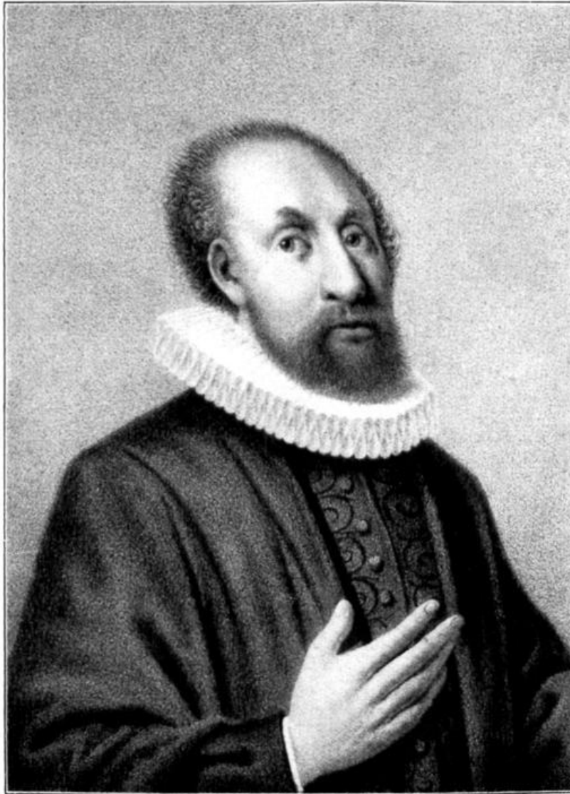
Abb. 12. Bonnus, Superintendent in Lübeck, reformiert 1543 im Auftrage des Bischofs Franz von Waldeck die fünf münsterischen Ämter, darunter auch Delmenhorst. S. 13.