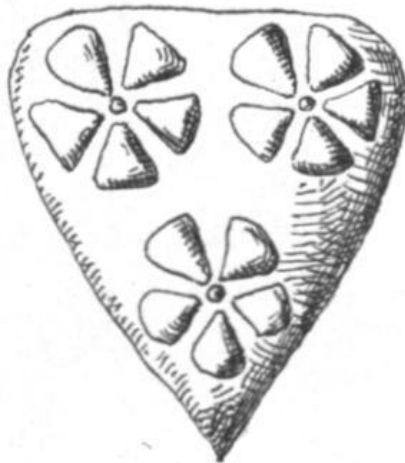
2. Burchard [I, 7].