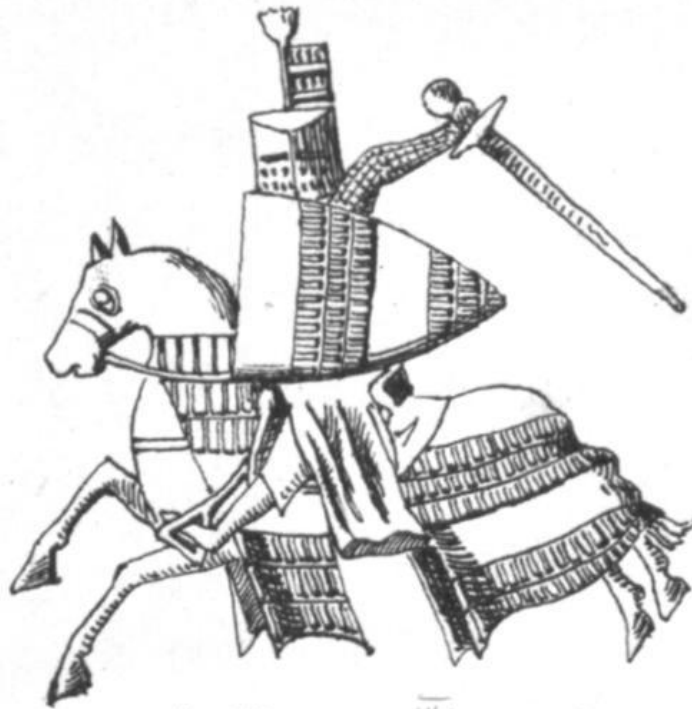
1. Heinrich III [I, 6]. Ketten Lophias.