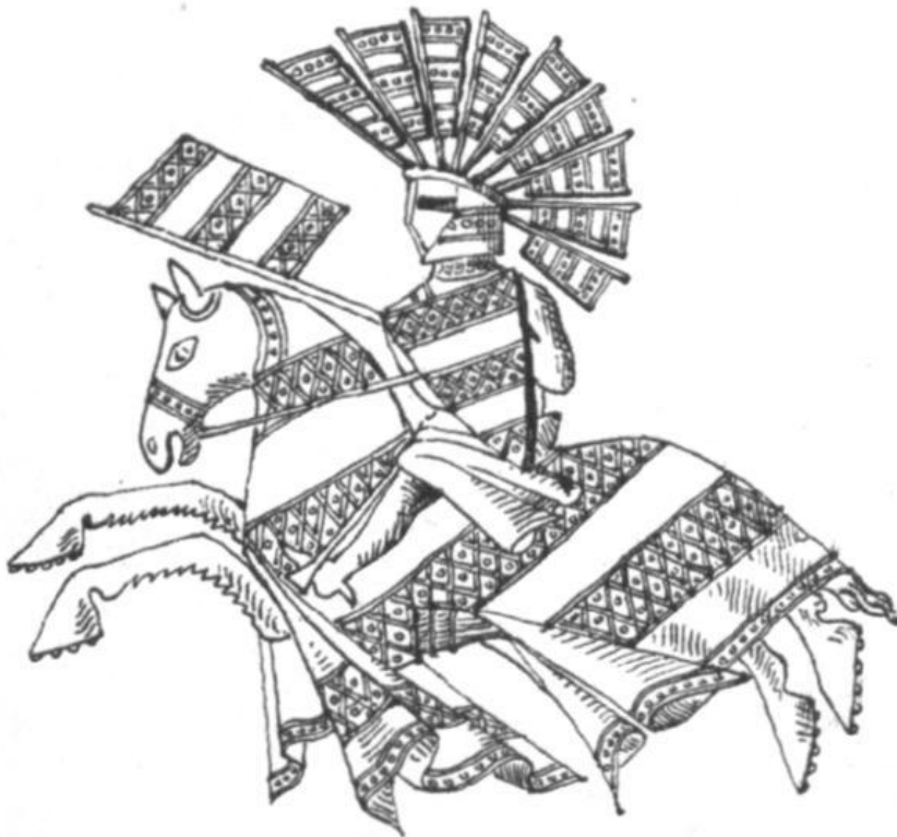
18. Otto. [II, 6].