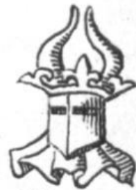
21. Otto. [III, 4]