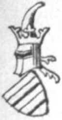
14. Christian. [I, 10]