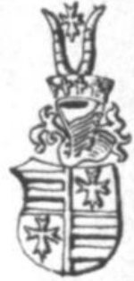
17. Johann IV. [II, 22]