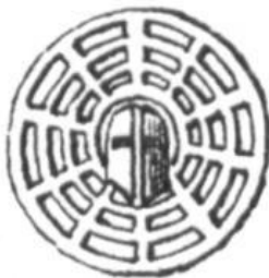
20. Christian. [III, 3]