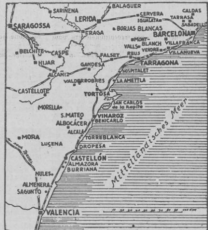
Rechts: Die nationalspanischen Truppen setzen nach der heutigen Rundfunkmeldung ihren Vormarsch im Süden fort und beherrschen nunmehr einen Küstenabschnitt von 110 Km. Breite. Bei Albucaer nahmen sie nach dem letzten Heeresbericht wichtige Stellungen. - Links: Nationalspanische Truppen begrüßen französische Grenzposten in den Pyrenäen, nachdem sie das Krantal genommen haben. (Karte Eisler-M)

führt der Campine-Kanal, der Antwerpen mit Lüttich verbindet.