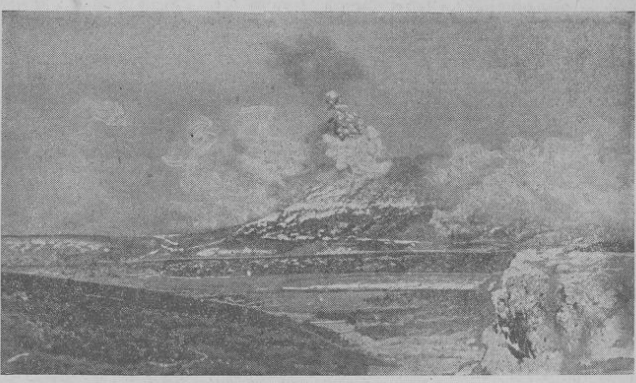
So schlägt die Luftwaffe bei Sewastopol zu. Von dem Einsatz unserer Luftwaffe beim Durchbruch von Sewastopol gibt diese Aufnahme ein anschauliches Bild...