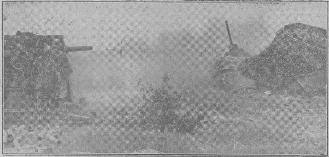
Schwere Panzer im Kampf mit Sowjet-Panzen. Von den Kämpfen unserer Truppen nördlich des Don. Schwere Panzer kämpfen feindliche Panzer im Direktkontakt...