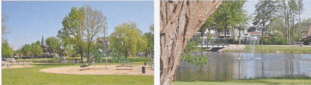
Neugestalteter Dorfpark in Bösel

Einwohner: 7.844; Geburten: 74; Sterbefälle: 69; Saldo: + 5; Zugezogene: 619; Fortgezogene: 637; Saldo: - 18; Bevölkerungsbilanz: + 13