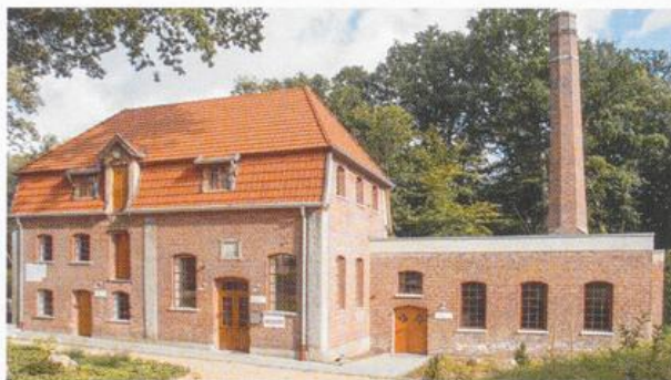
Das Industriedenkmal „Bredemeyers Hof“