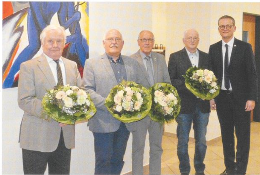
Bürgermeister Tobias Averbek ehrt verdiente Mitbürger