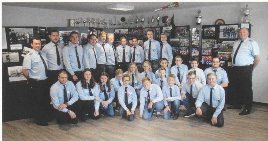
50 Jahre Jugendfeuerwehr Barßel – die Jugendlichen mit ihren Jugendwarten und Betreuern