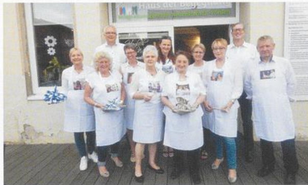
Das Kochteam freut sich über den großen Zuspruch und den anhaltenden Erfolg der länderbezogenen Kochabende.