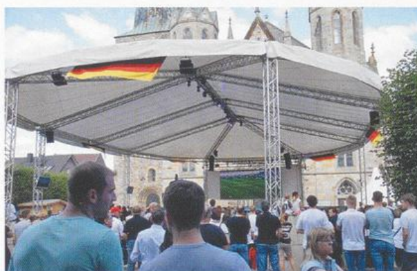
Der Paragu vom Public Viewing