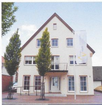
Das Archäologisch-Historische Informationszentrum „ArchäoVisbek“ an der Rechterfelder Straße 1 in Visbek