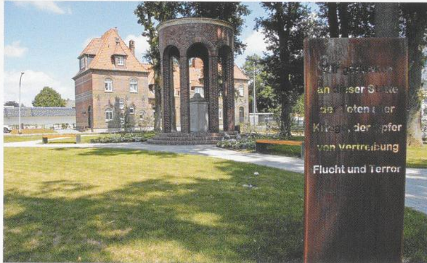
Ehrenmal an der Quakenbrücker Straße nach der Umgestaltung (Text auf der Tafel: Wir gedenken an dieser Stelle der Toten aller Kriege, der Opfer von Vertreibung, Flucht und Terror)

Einwohner: 13.063; Geburten: 123; Sterbefälle: 134; Saldo: -11; Zugezogene: 942; Fortgezogene: 880; Saldo: +62; Bevölkerungsbilanz: + 51