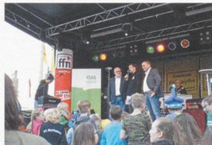
Bilder vom Eisenfest