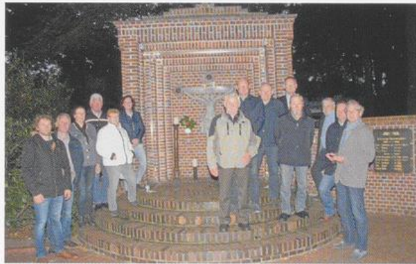
Die Klus in Osterlindern