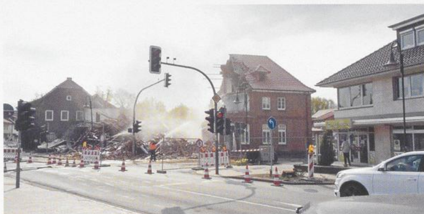
Abriss der ehemaligen Gaststätte Thole-Vorwerk