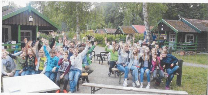
Ferienfreizeit der Roten Schule beim Schloss Dankern