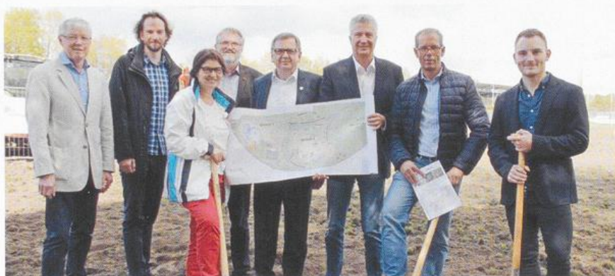
Spatenstich für den 2. Bauabschnitt im Mehrgenerationenpark