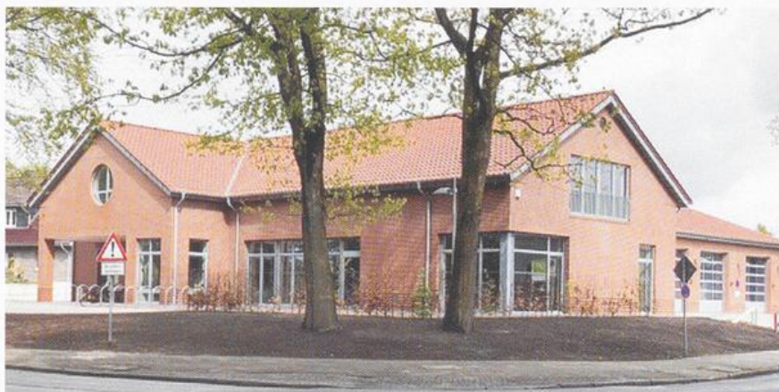
Das neue Feuerwehrhaus in Bevern