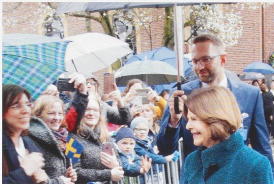
Hunderte Schaulustige begrüßen Königin Silvia von Schweden bei ihrem Besuch in Kroge.