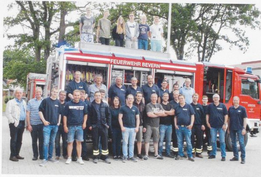
Die Freiwillige Feuerwehr Bevern mit dem neuen LF10