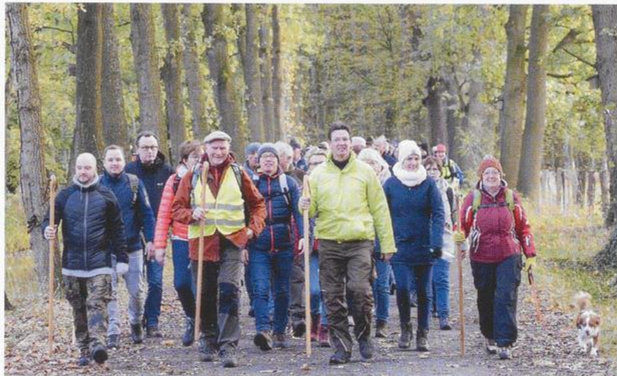
An der Eröffnungswanderung des Kardinalsweges nehmen mehr als 150 Pilger teil, die sich nach Erteilung des Pilgersegens auf den rund 14 Kilometer langen Weg machen und sich dabei mit den Tugenden des Kardinals von Galen befassen.