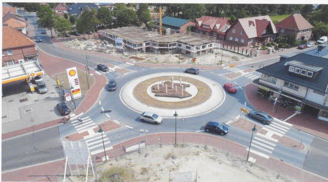
Luftaufnahme des neuen Kreisverkehrsplatzes in der Ortsmitte von Molbergen