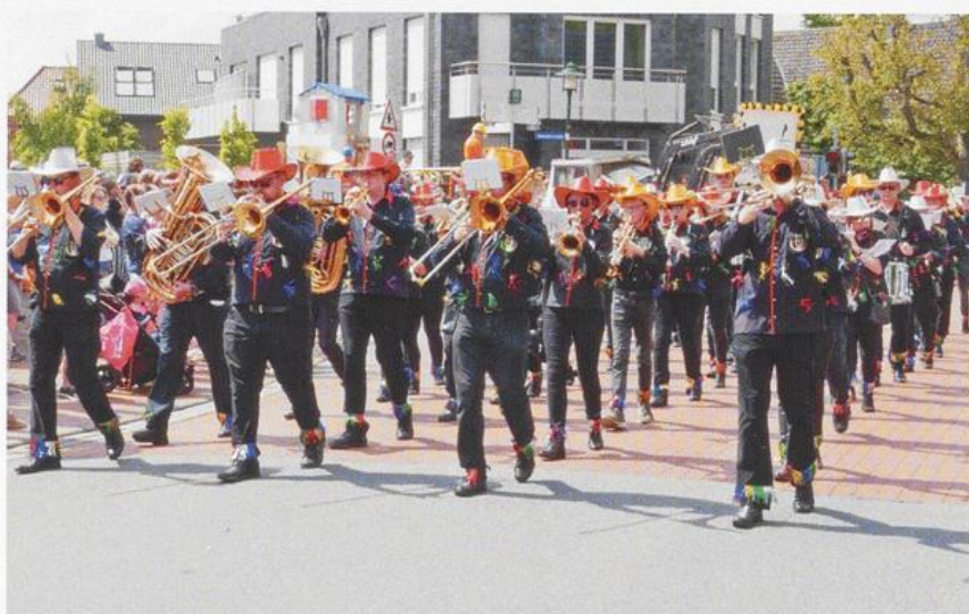
Musikverein Bakum während des Volksfestumzuges; der Musikverein hat in diesem Jahr sein 100-jähriges Bestehen gefeiert.