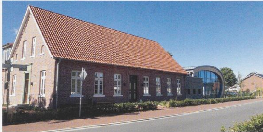
Neue KiTa „Thuiners Gorn“

bis zu Dreijährigen bereits eingezogen sind, zeigt sich als Anbau in Ei-Form, der etwas Neues symbolisiert, gleichzeitig aber auch für Schutz und Geborgenheit der betreuten Kinder steht