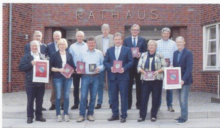
Vorstellung der Chronik Visbek, Band 3