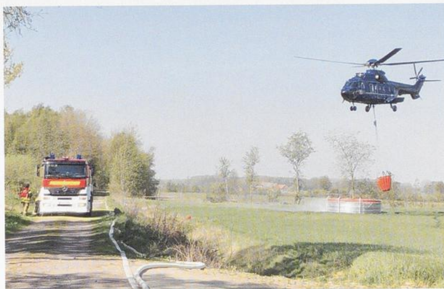
Nachlöscharbeiten: Da das Feuer unterirdisch weiterschwelt ist sogar ein Hubschrauber der Bundeswehr im Einsatz. 1.400 Liter Wasser hat er dabei und kann so einzelne Glutnester löschen.