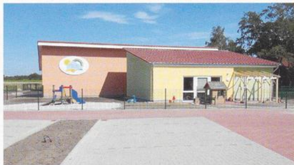
Das neue Krippengebäude an der Kindertagesstätte Bunte-Welt in Lastrup wurde im Sommer 2019 fertig gestellt.