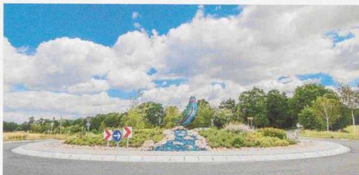
Kreisel Wildeshau- ser Straße

Die Kreisverkehrsplätze entlang der Visbeker Entlastungsstraße werden auf Initiative der Mittelstandsvereinigung Visbek neu gestaltet. Verschiedene Unternehmen aus der Gemeinde haben die Gestaltung finanziert