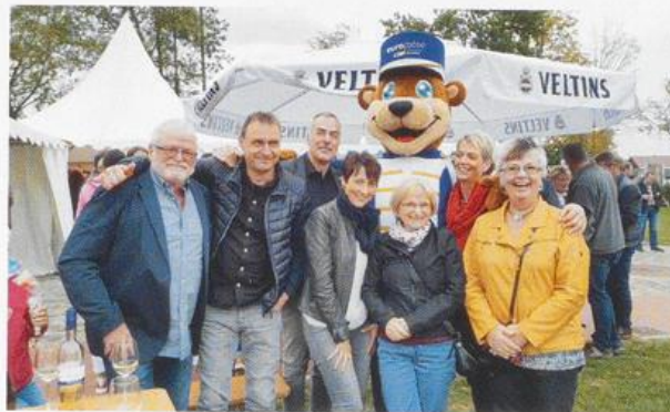
„EUBO“ (das neue Maskottchen der Gemeinde) begrüßt eine Delegation der Partnerstadt Dippoldiswalde zu den EURO-Musiktagen.