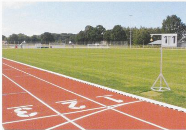
Neue Sportstätte am Galgenmoor zwischen Vahrenener Straße und Westallee