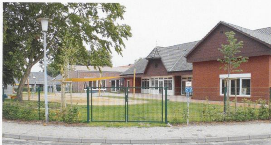
Die neue Kinderkrippe „Schatzkiste“ und die umgebaute Kindertagesstätte „St. Marien“