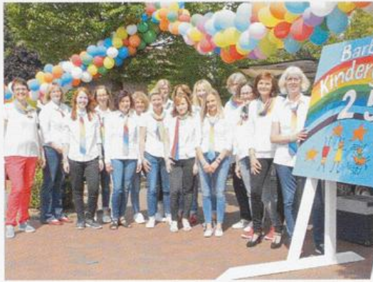
Jubiläumsfeier des Barbara-Kindergartens