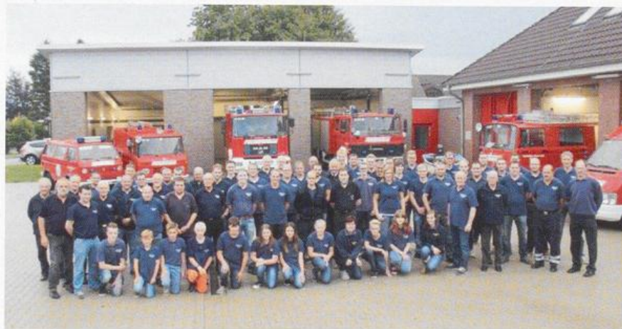
Kreisfeuerwehrtag in Barßel