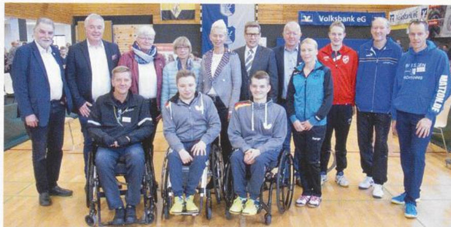
Gemeinsames Gruppenbild mit allen Aktiven und Beteiligten der Veranstaltung „Alle an einem Tisch“ am 27.10.2018