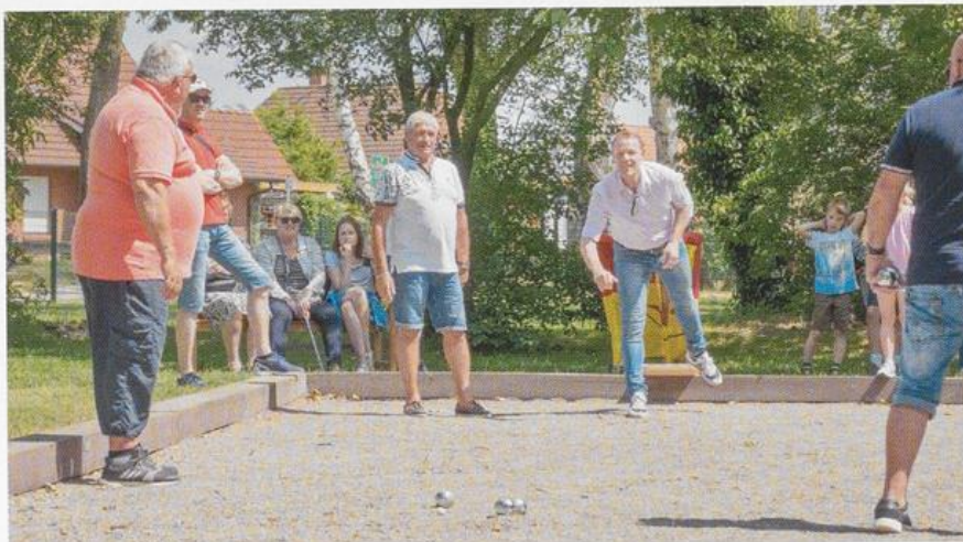
Boulespiel mit Besuchern aus Épouville