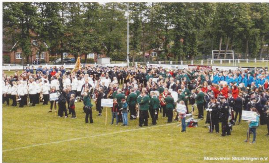
70. Kreismusikfest des Kreismusikverbandes Cloppenburg