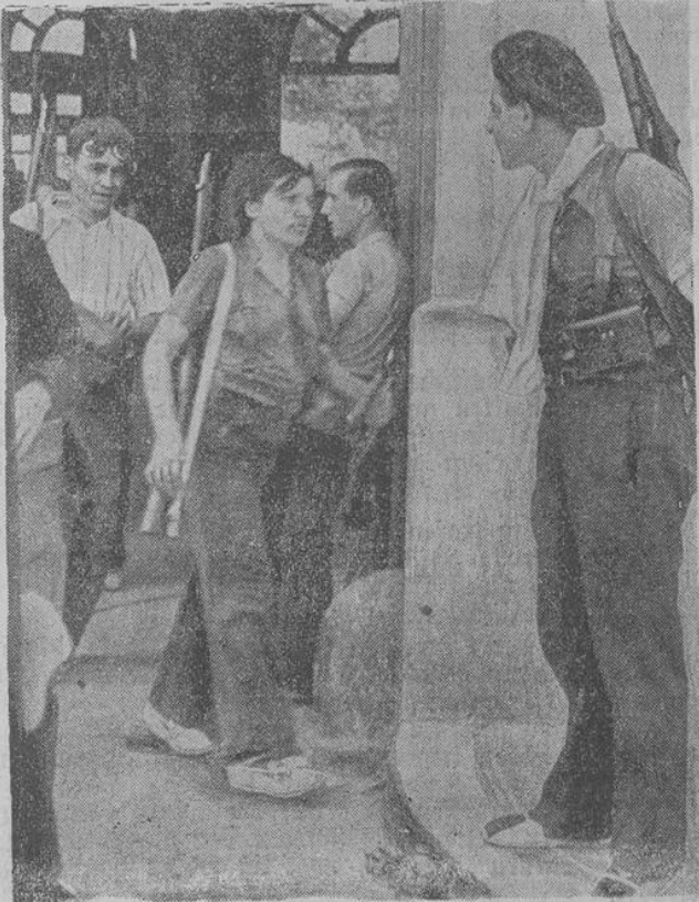
Die roten Schreckenstage in Spanien

4. Der DRL stellt für den Übungsbetrieb des DJ, soweit wie möglich, seine Übungsplätze, Übungsgeräte und für die Mitarbeit im Jungvolk geeignete Übungsleiter zur Verfügung.