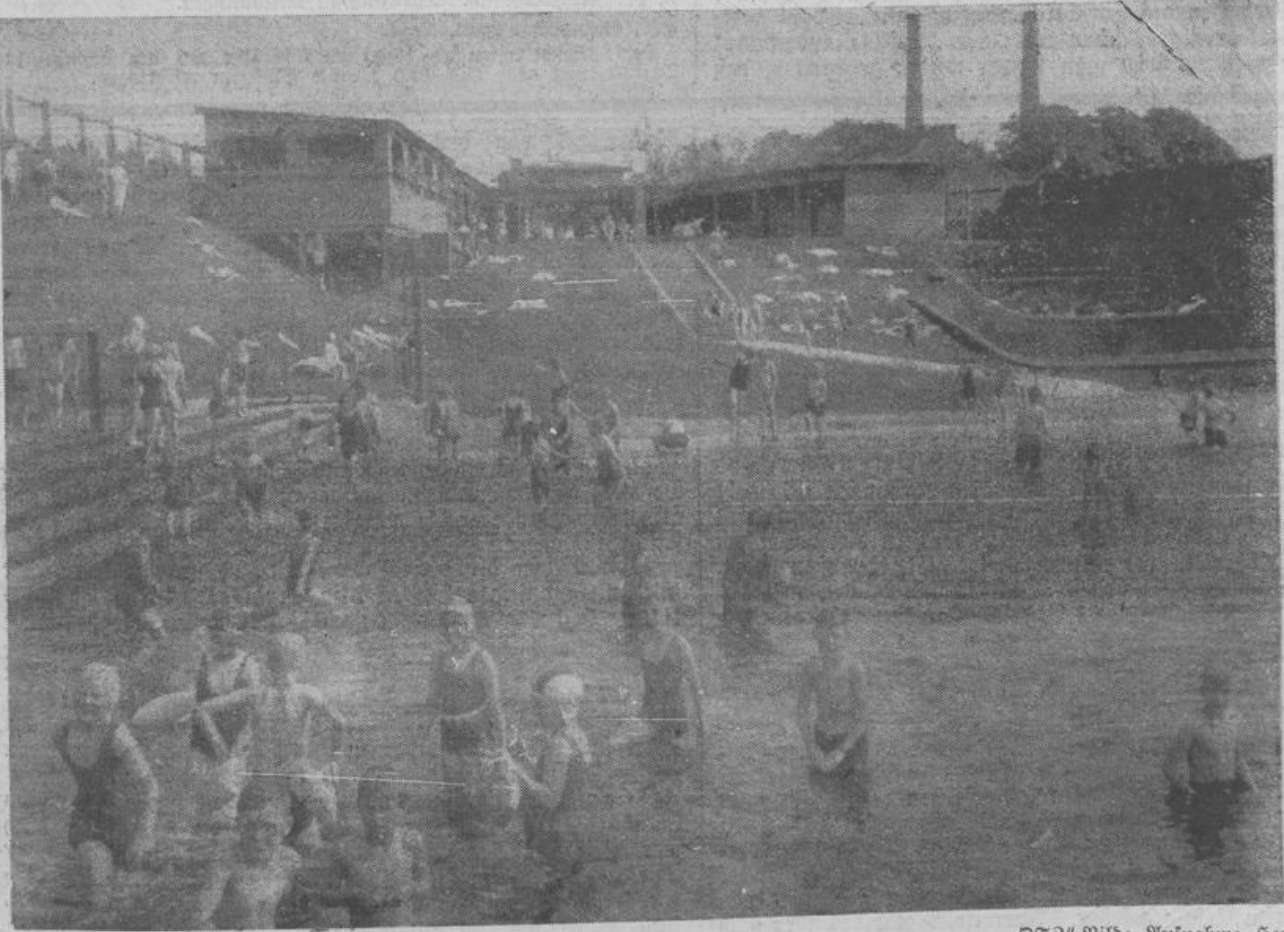
„DAF“-Bild: Aufnahme Berlin.

Der Betriebsführer, so führte der Redner weiter aus, mußte bedenken, daß es heute um wertvolle deutsche Menschen gehe und nicht um die Erzielung möglichst hoher Gewinne aus dem Betriebe. Jedem schaffenden deutschen Menschen, der fleißig arbeitet und seinen Verpflichtungen nachkommt, solle das gewährt werden, was er an Ansprüchen an das Leben zu stellen habe, und zwar solle er die gleichen Ansprüche haben, wie jeder andere Volksgenosse, der mehr