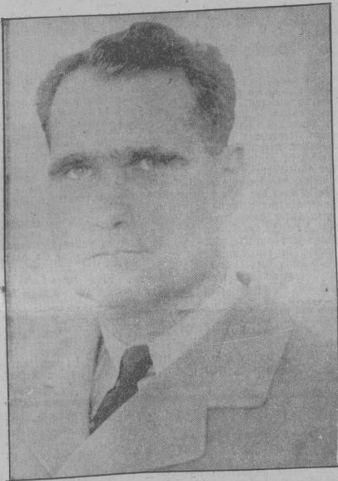
München, 27. Oktober.

Parteiabordnung unter Rudolf Heß' Führung verließ München