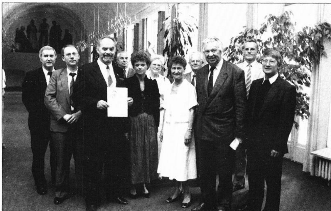
Juni 1989, Mühlen wird Bezirkssieger im Wettbewerb „Unser Dorf soll schöner werden“