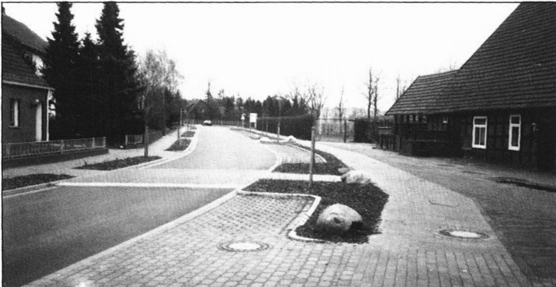
Alte Reichsstraße in Lastrup nach der Neugestaltung mit Mitteln aus der Dorferneuerung (Herbst 1994)