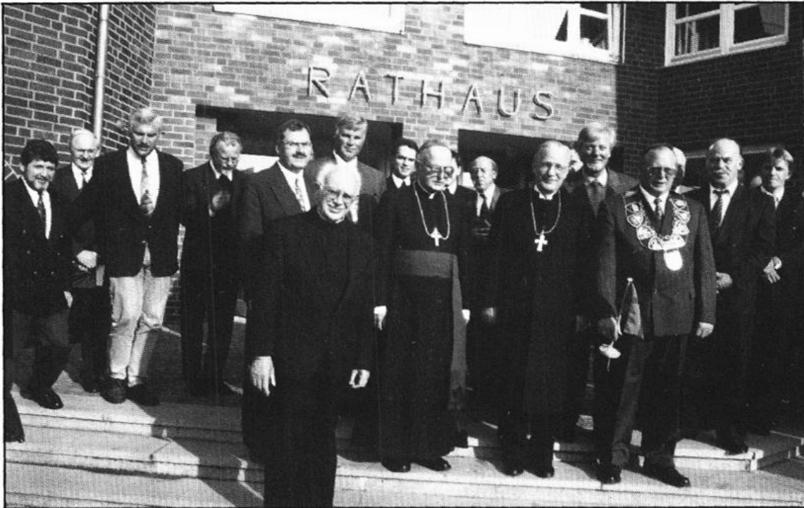
Eröffnung der 1175-Jahr-Feier mit prominenten Gästen