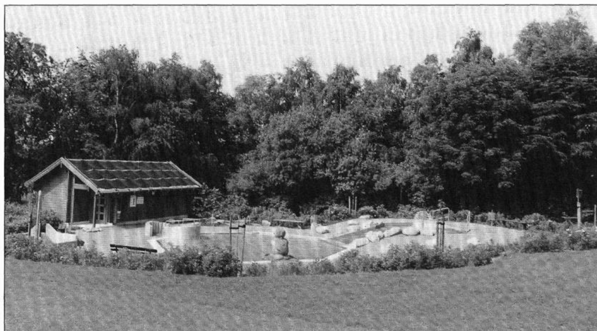
Der neue Wasserspielgarten im Freibad Damme. Es handelt sich hierbei um eine geschlossene Anlage, in der Kinder spielerisch lernen, mit dem Element Wasser umzugehen.