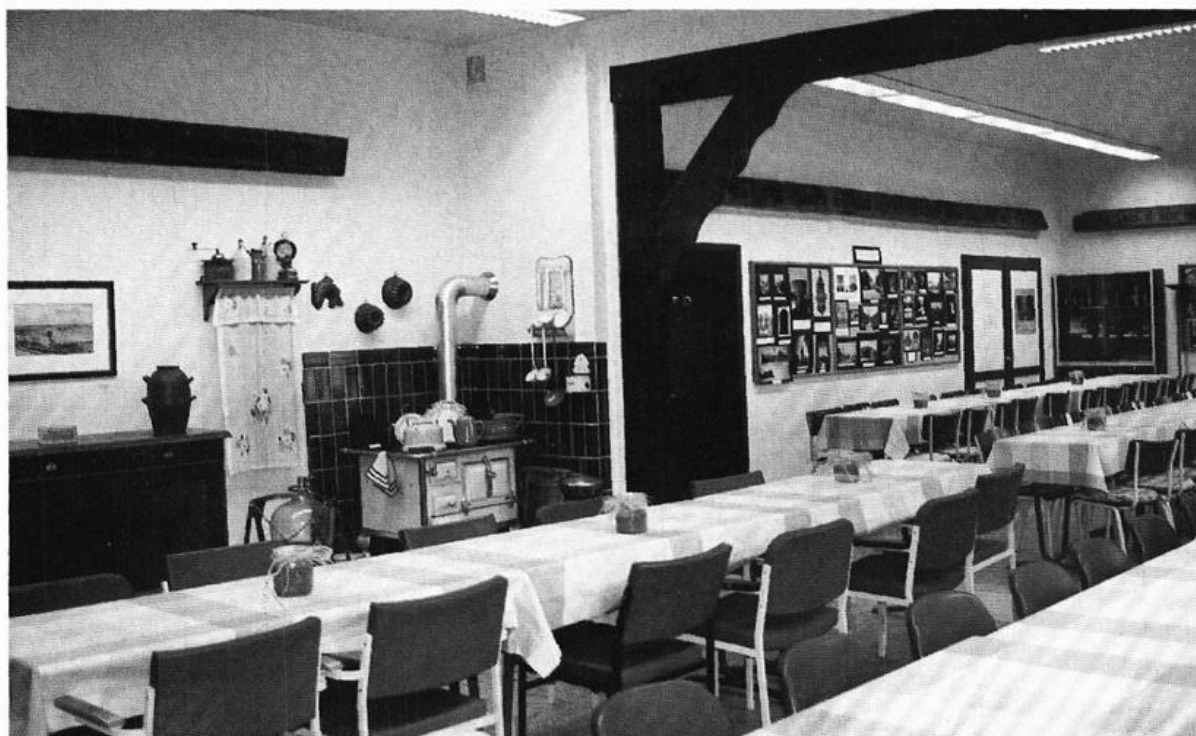
Das Heimathaus des Heimatvereins Bakum wurde wohnlich eingerichtet und bietet 90 - 100 Personen Platz. Die Spruchbalken (der längste mißt 7,5 m) stammen aus dem Jahre 1924 und sind ein Geschenk des Hofes Frilling-Westerbakum. Ein kleinerer Raum wurde als Archiv eingerichtet; in ihm werden Urkunden, Fotos, Bücher und über 2000 Totenzettel von Verstorbenen der Gemeinde Bakum verwahrt.