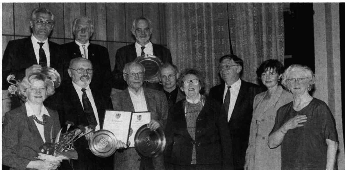
Gruppenfoto aus Anlaß des 10jährigen Bestehens der Patenschaft zwischen der „Ortsgemeinschaft Tscherman und Umgebung“ und der Gemeinde Steinfeld.