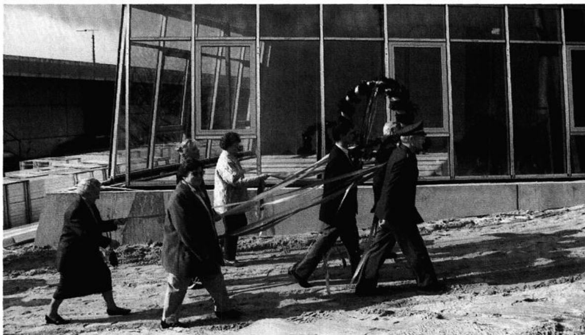
Richtfest zum neuen Industrie Museum Lohne am 24.04.1999.