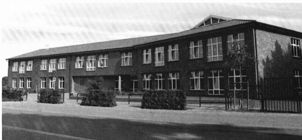
Die neue Grundschule in Molbergen.