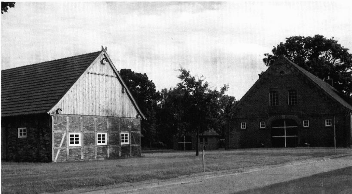
Heimathaus Bösel mit Scheune und Brotbackhaus.