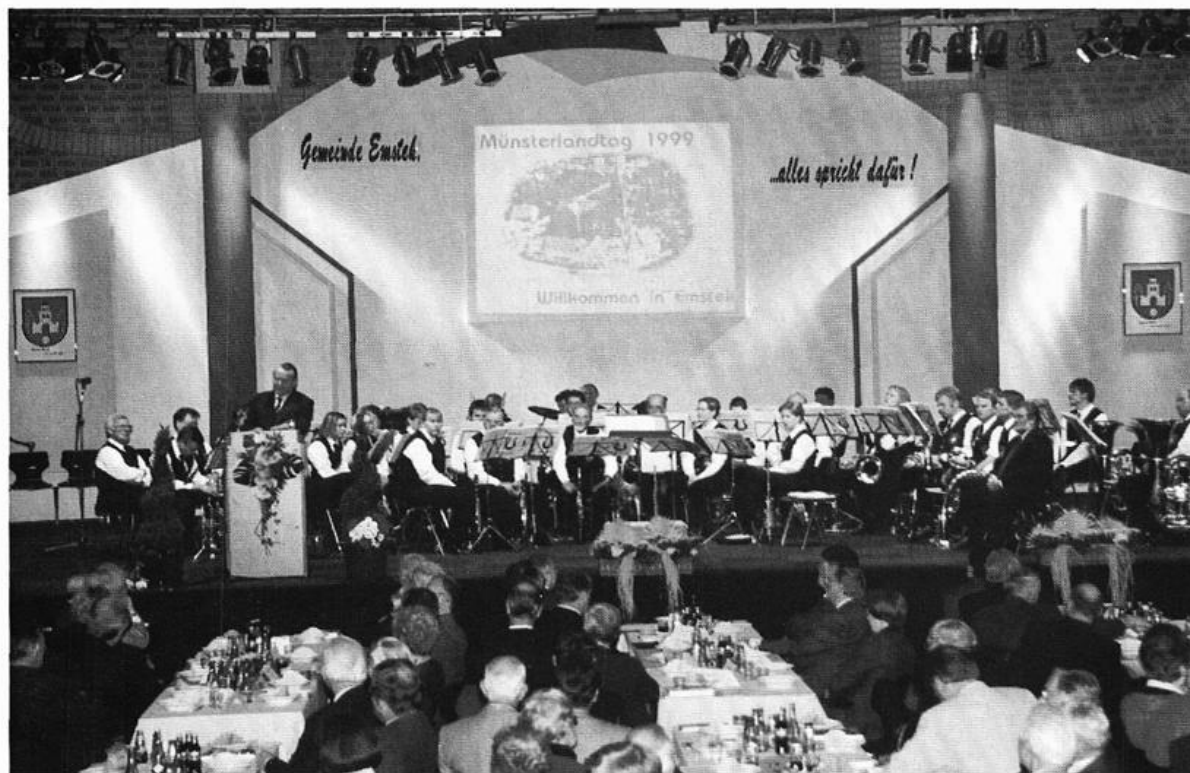
Münsterlandtag am 13.11.1999 in der Gemeinde Emstek.