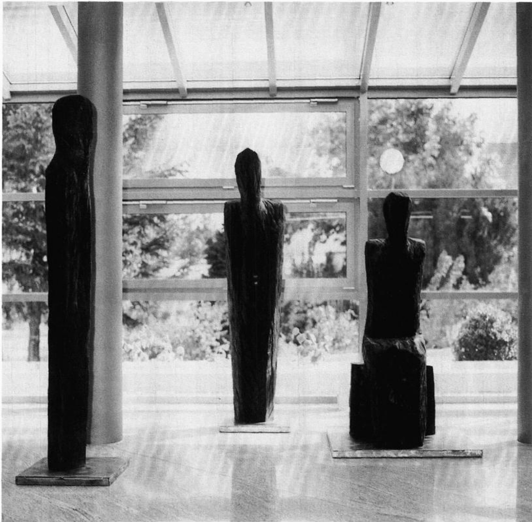
Figurengruppe, Mobringen/Harz Eiche, geflämmt, polychromiert

Die Vielfalt der Stile, Formen, Verfahren und Erscheinungsformen, in denen sich die Kunst der Gegenwart darbietet, läßt einen umfassenden Pluralismus vermuten. Kunst trat sicher noch nie so differenziert auf, war aber zugleich auch noch nie so zielgerichtet auf Realisierung von „Kunst als Kunst mit realem Lebensbezug“ ausgerichtet; nicht das „l'art pour l'art“, sondern diametral entgegengesetzt als Kunst, die sich auf Lebenszusammenhänge beruft. Genau in diesem Zusammenhang sehe ich die Arbeiten von Ulrich Fox.