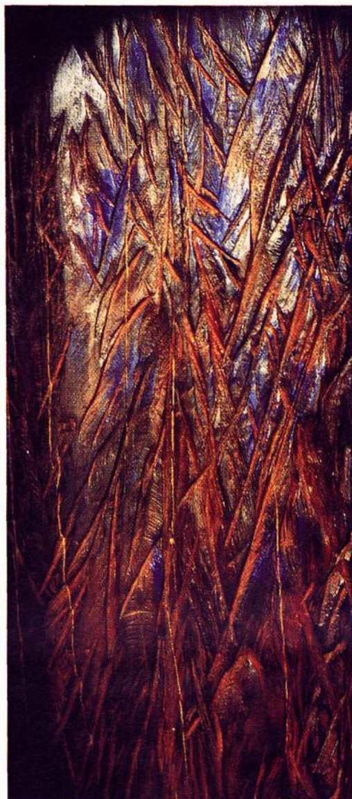
Ausschnitt/Oberfläche Figurengruppe: Tuchmacher Freudenstadt, Martin-Luther-Platz Eiche, geflämmt, polychromiert

uns Spuren in seinen Arbeiten, die uns mit der Problematik vertraut machen können, wenn wir uns auf die Arbeiten und ihre Bedeutung einlassen.