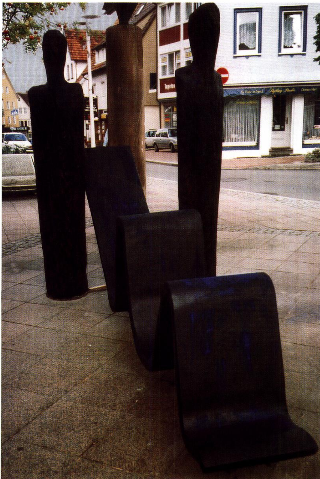
Figurengruppe: Tuchmacher Freudenstadt, Martin-Luther-Platz Eiche, geflämmt, polychromiert