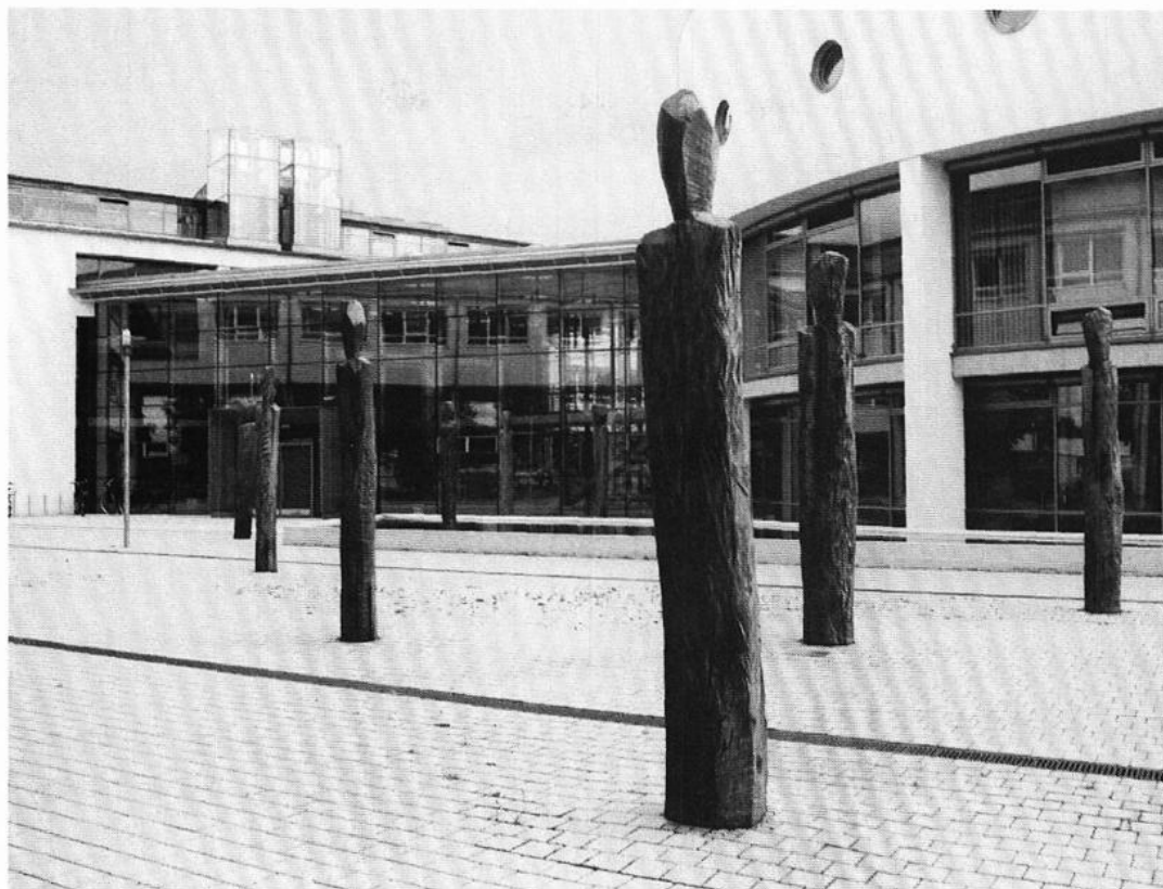
Farbig gefasste Skulpturengruppe „Miteinander“ vor dem neuen Kreishaus in Vechta

so autonom wirken. Sie behaupten sich in ihrer Archaik als Symbol des Miteinander in einer Umgebung, die nicht zwangsläufig diesen Eindruck vermittelt. Kunst, die sich im Vorbeigehen erfahren läßt, ohne Überwindung von Schwellenangst und dem Zwang, sich kulturell-intellektuell unterhalten zu müssen. Insgesamt ein gutes Beispiel, wie sich Architektur und Skulptur im Wechselspiel in der Wirkung steigern.