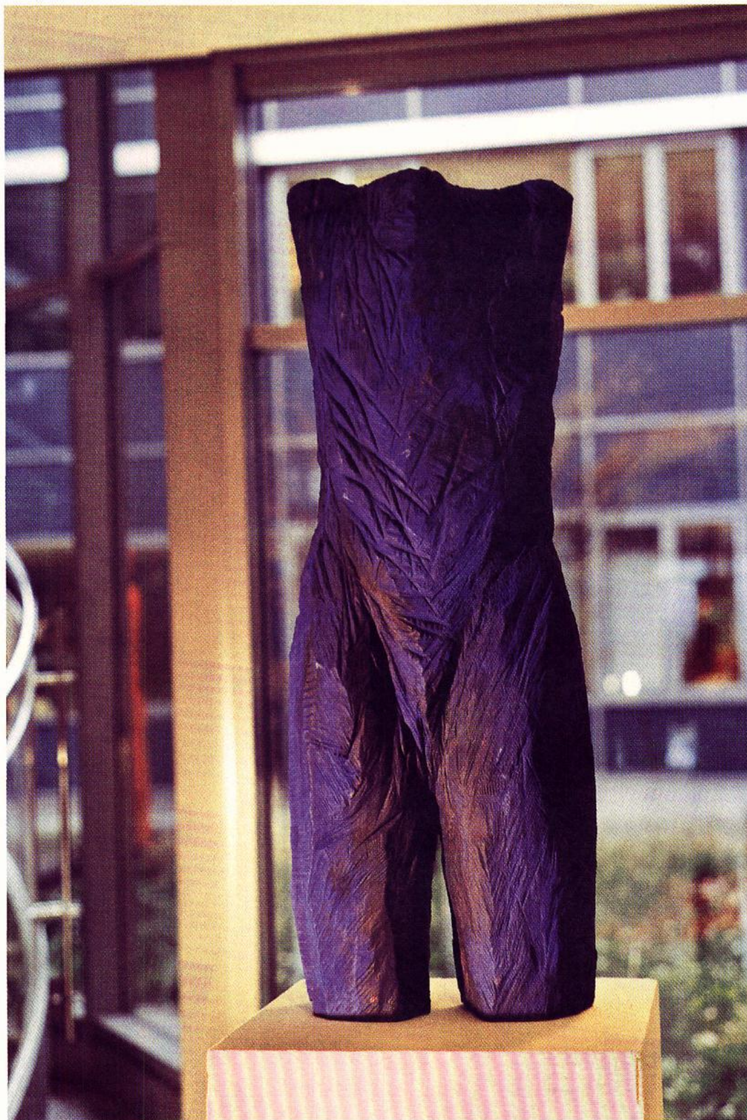
Torso Esche, polychromiert