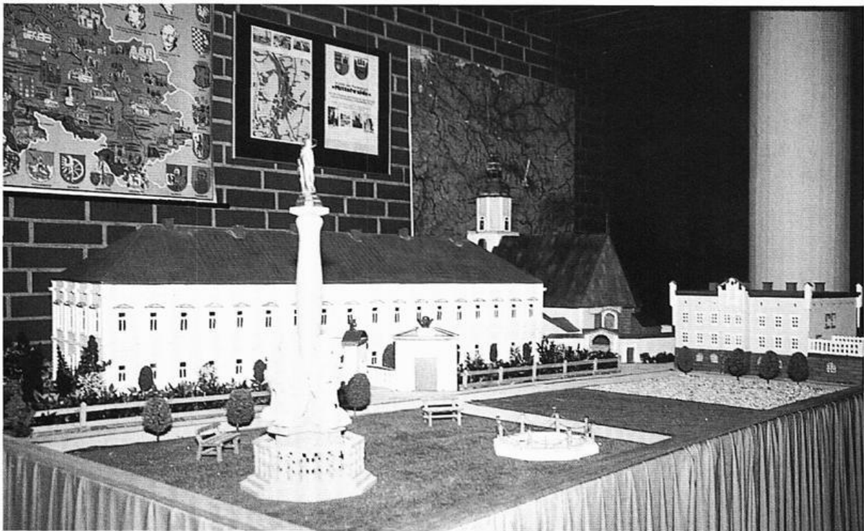
Modell der zentralen und stadtbildprägenden Gebäude Mittelwaldes am Ring mit Schloß, Schloßkirche, Rathaus und Mariensäule im Eingangsbereich des Lohner Rathauses

Mantel über eine heimatvertriebene Familie hält, an das Leid der Vertreibung. Die Statue stammt von der Grafschafter Künstlerin Judith von Eßen. Sie schuf auch die Gedenktafel, die zum 50. Jahrestag der Vertreibung am Rathaus angebracht wurde. 6 Im Rathaussaal befindet sich neben dem Wappen der Lohner Partnerstadt Rixheim im Elsaß 7 das Wappen Mittelwaldes. Unter den Abbildungen von Persönlichkeiten ist im Bronzerelief an der Stirnseite des Rathaussaales der Mittelwalder Kunstmaler und Lohner Ratsherr Joseph Andreas Pausewang abgebildet. Die Amtskette des Lohner Bürgermeisters schmückt u.a. auch das Wappen Mittelwaldes. Die „Heimatgemeinschaft Mittelwalde“ unterhält im Erdgeschoß des Rathauses einen großen Archivraum, in dem Dokumente der Geschichte Mittelwaldes aufbewahrt und ausgestellt sind sowie viele Zeichnungen und Gemälde des oben genannten Mittelwalder Malers, der in Dresden und München seine Ausbildung erfahren hat. Seine Landschaftsbilder, Porträts und Stilleben gehören zum Bestand der Kulturstiftung („Luzie-Uptmoor-Stiftung“), die sich die Bewahrung, Dokumentation und Ausstellung der Werke Lohner oder in Lohne wirkender