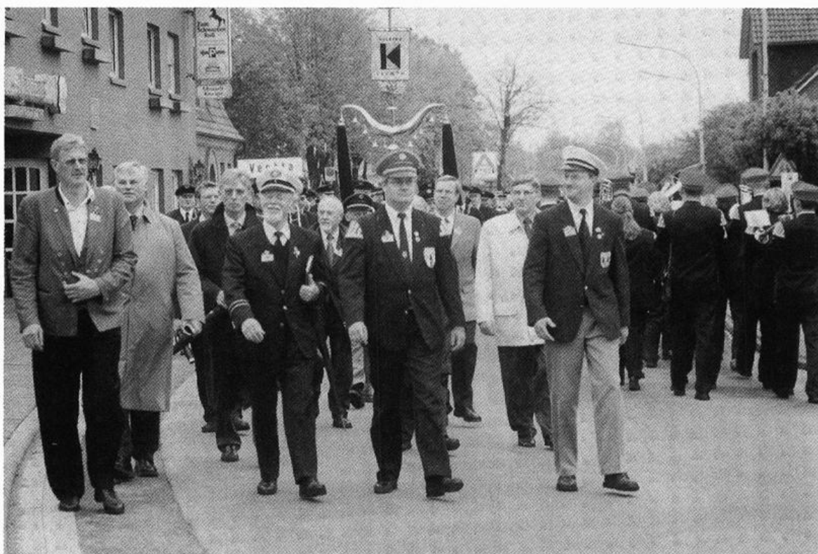
Musikerbundesfest 2002 in Neuenkirchen