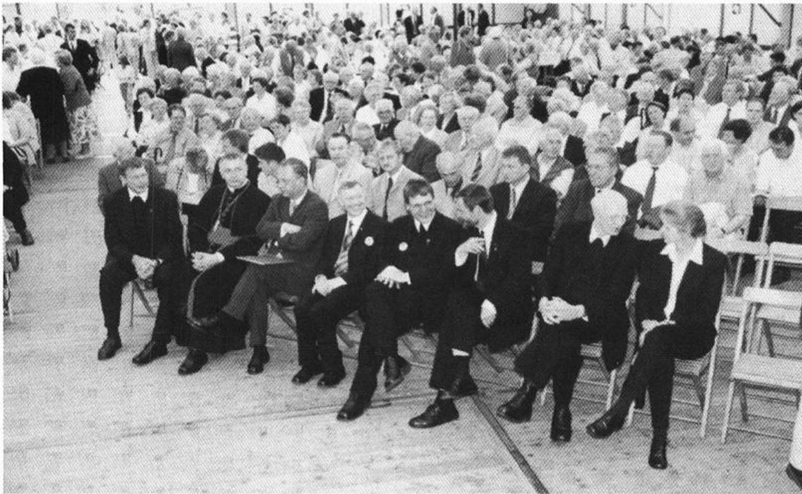
97. Oldenburger Kolpingtag im Juni 2002 in Visbek