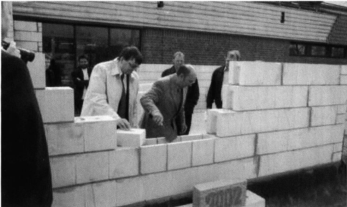
Grundsteinlegung der neuen Sport- und Mehrzweckhalle in Lindern am 12. April 2002