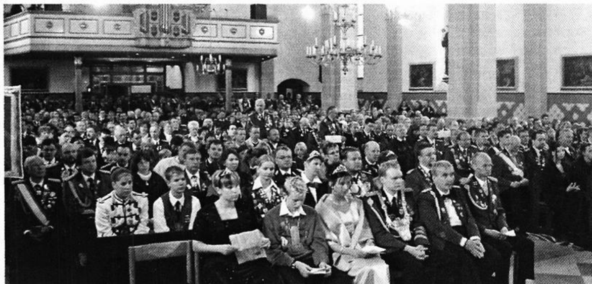
Festgottesdienst anlässlich des Bundesjungschützentages in Molbergen