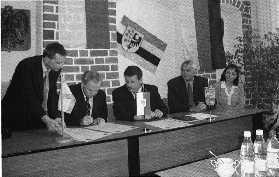
Bürgermeister Hubert Frye (2. v. l.), Bürgermeister Boguslaw Krasucki (Mitte) und der Ratsvorsitzende Waldemar Wawrzynski (2. v. r.) während der Unterzeichnung der Partnerschaftsurkunde am 1. Juni 2002 in Sroda Slaska