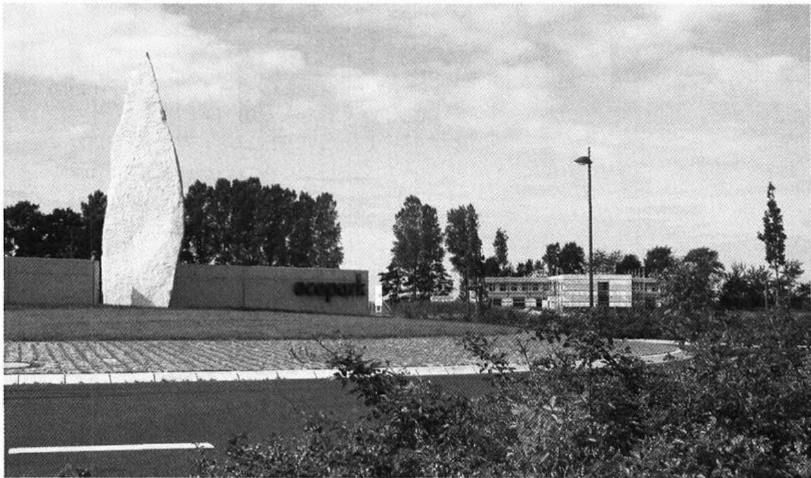
„ecopark“ in Drantum, Gemeinde Emstek