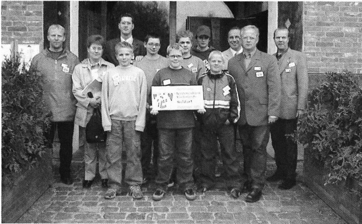
Für ihr Kinder- und Jugendbeteiligungsprojekt „Holdorf - Gemeinde zum Mitmachen“ erhält die Gemeinde Holdorf den 2. Preis beim Landeswettbewerb „Niedersachsen – Kinderland“