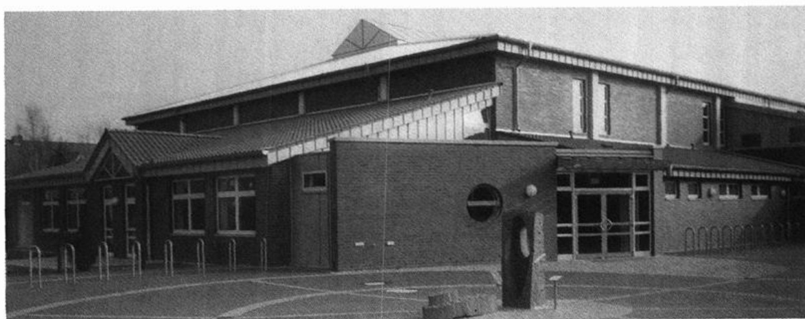
Die neue Sport- und Mehrzweckhalle der Gemeinde Lindern wurde am 05.07.2003 der Öffentlichkeit übergeben.