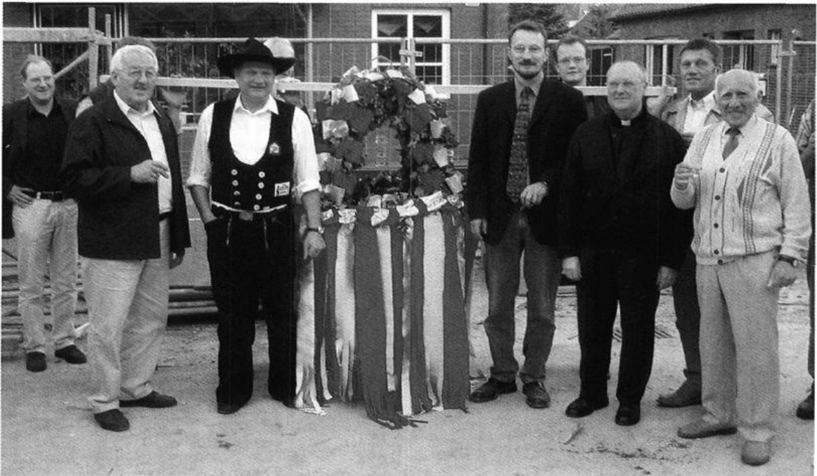
Handwerker bringen die Richtkronen für das neue Böseler Rathaus