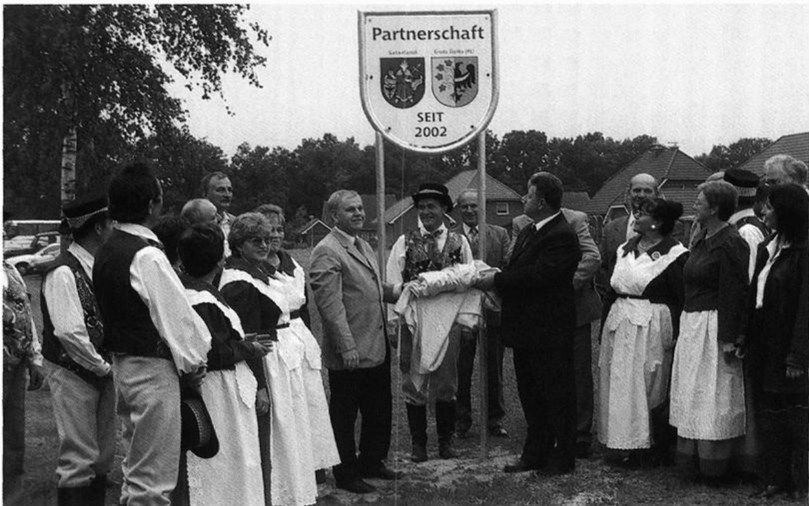
Die Bürgermeister der Partnergemeinden Saterland und Sroda Slaska bei der feierlichen Enthüllung eines Partnerschaftsschildes am 6. September 2003