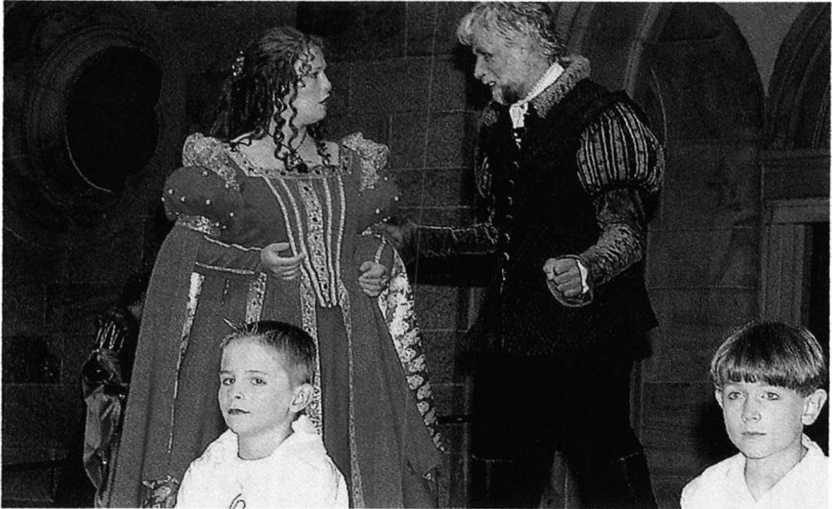
Großartige schauspielerische Leistungen und prächtige Kostüme bewunderten mehr als 5.000 Besucher bei den Freilichtaufführungen des ökumenischen Laienschauspiels „Jedermann“ auf dem St. Laurentius Kirchplatz in Langförden.