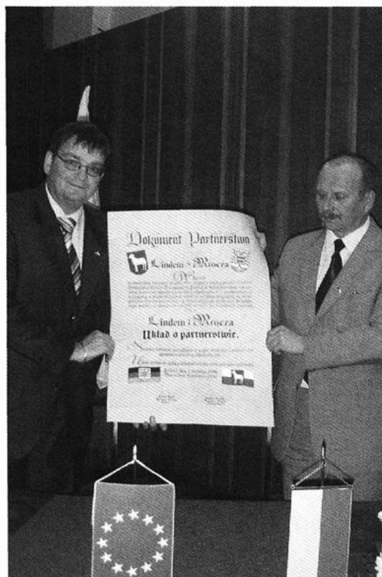
Am 24.09.2004 wird die Gemeindepartnerschaft zwischen Lindern und Mroczka in Polen beurkundet