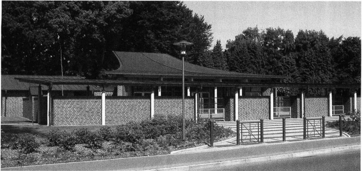
Am 12.09.2004 wurde die neue Friedhofskapelle in Emstek eingeweiht