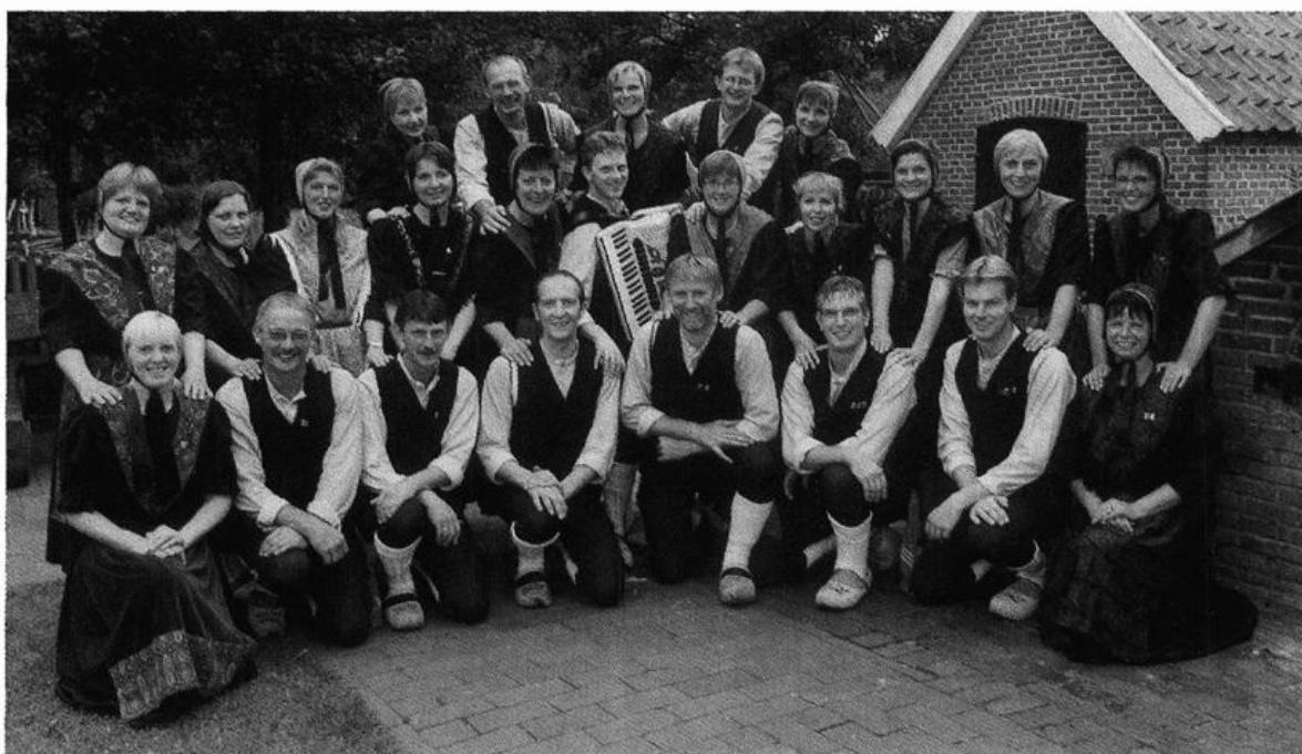
Die „Seelter Dons- und Drachtenkoppel“ besteht seit 25 Jahren