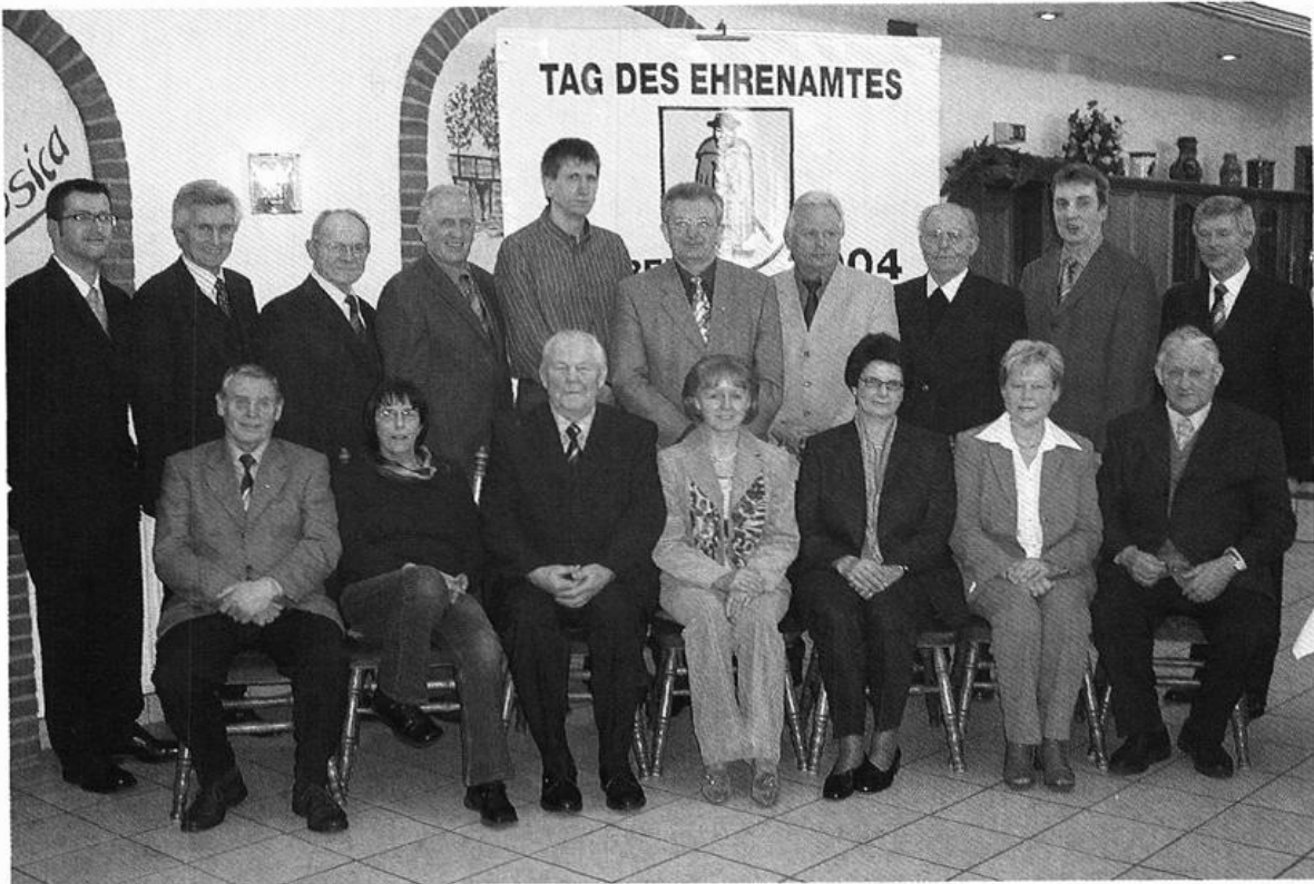
13 Bürger aus der Gemeinde Garrel werden am 26.02.2004 zu Ehrenamtspreisträgern ernannt