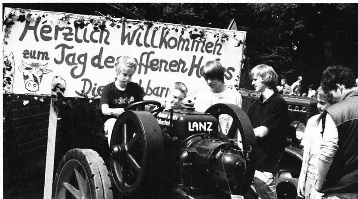
Jugend und Oldtimer beim Tag des Offenen Hofes in Hammel am 21. Juni 2008