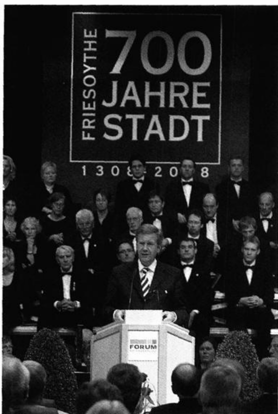
Großer Festakt mit dem Nieders. Ministerpräsidenten Christian Wulff und 400 Ehrengästen zum 700jährigen Jubiläum der Stadt Friesoythe am 13. September 2008 im Forum am Hansaplatz