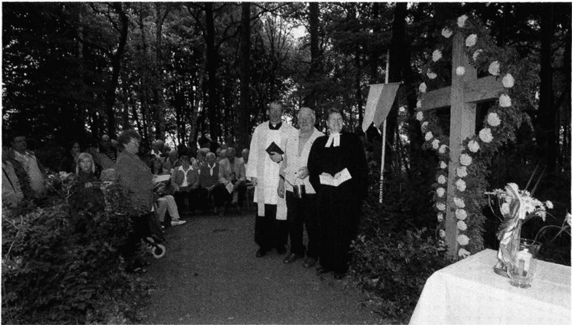
Weihe des Gedenkkreuzes auf der Dersaburg am 25. Mai 2008