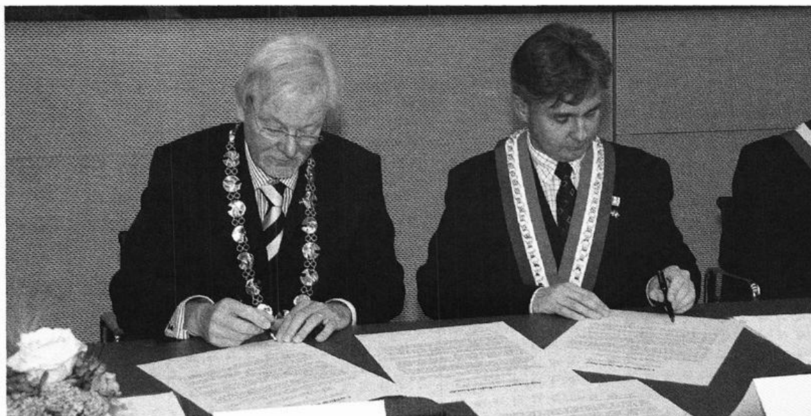
Bürgermeister Uwe Bartels und der Präsident des Gemeindeverbandes Pays Léonard, Nicolas Floch, besiegelten am 8. September 2008 mit ihrer Unterschrift die Städtepartnerschaft zwischen dem französischen Gemeindeverband und der Stadt Vechta.