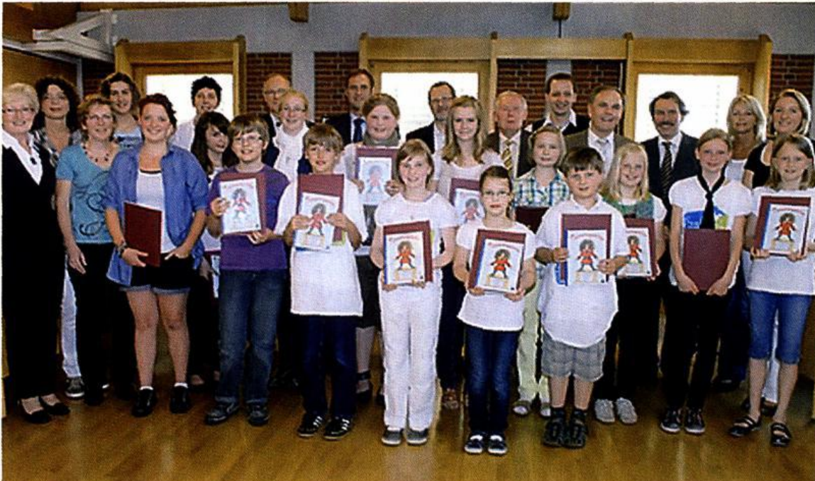
Die Gewinnerinnen und Gewinner sowie die Juroren des saterfriesischen Vorlesewettbewerbs; erstere erhielten ein Buch vom Tuusterpäiter.