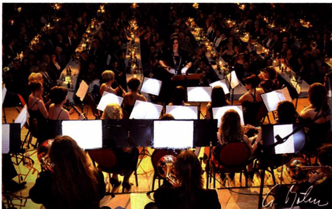
Jubiläumsveranstaltung zum 100-jährigen Bestehen des Musikvereins Molbergen in der voll besetzten Dreifeld-Sporthalle