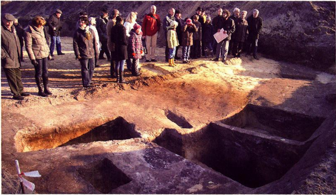
Ausgrabungen im Baugebiet „Helms Esch“