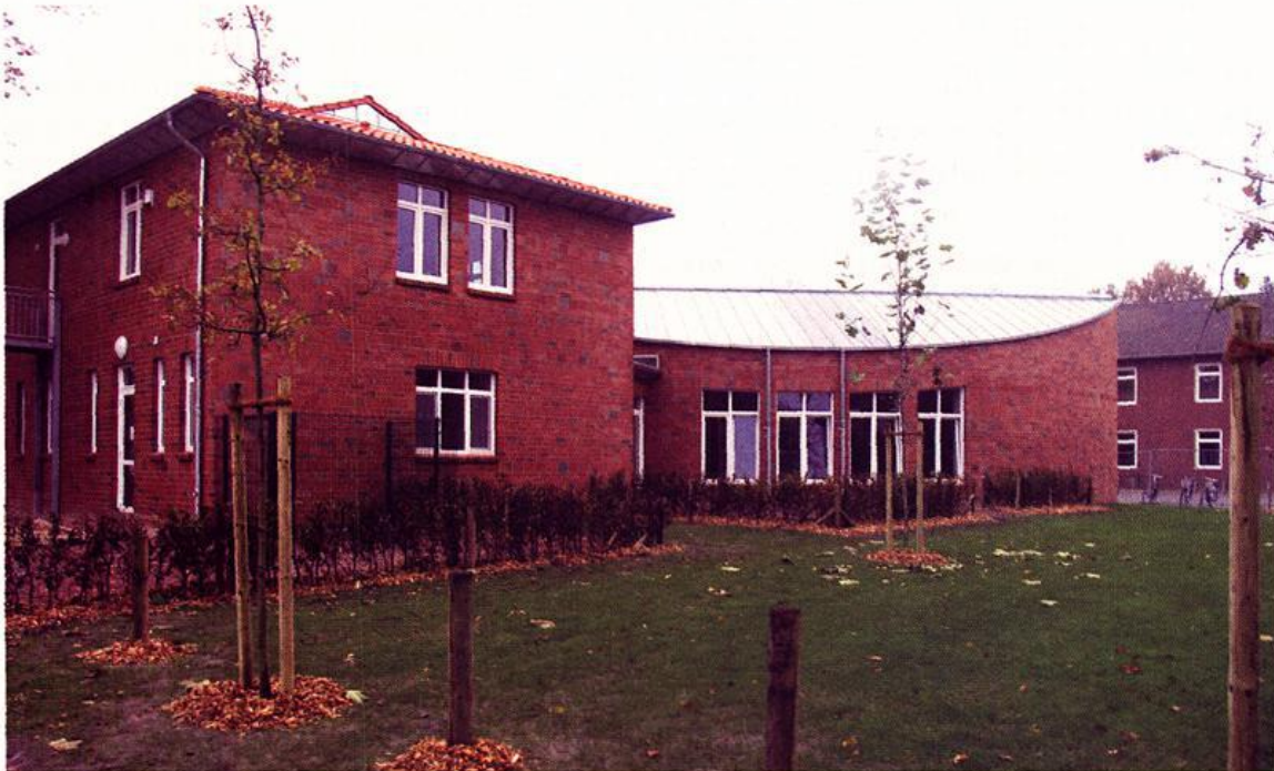
Erweiterungsbau an der Anne-Frank-Schule