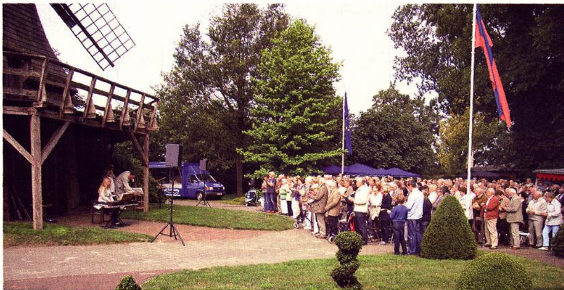
Gottesdienst anlässlich des Mühlentages bei „Diekmanns Mühle“