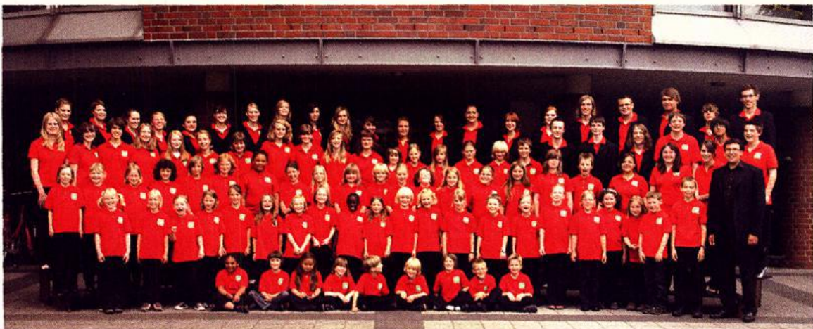
Der Cloppenburgener Kinderchor