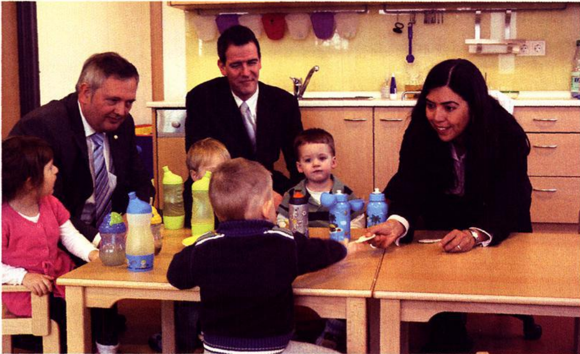
Niedersachsens Sozialministerin Aygül Özkan besucht die neue Kindertagesstätte St. Johannes an der Immenstraße in Garrel.