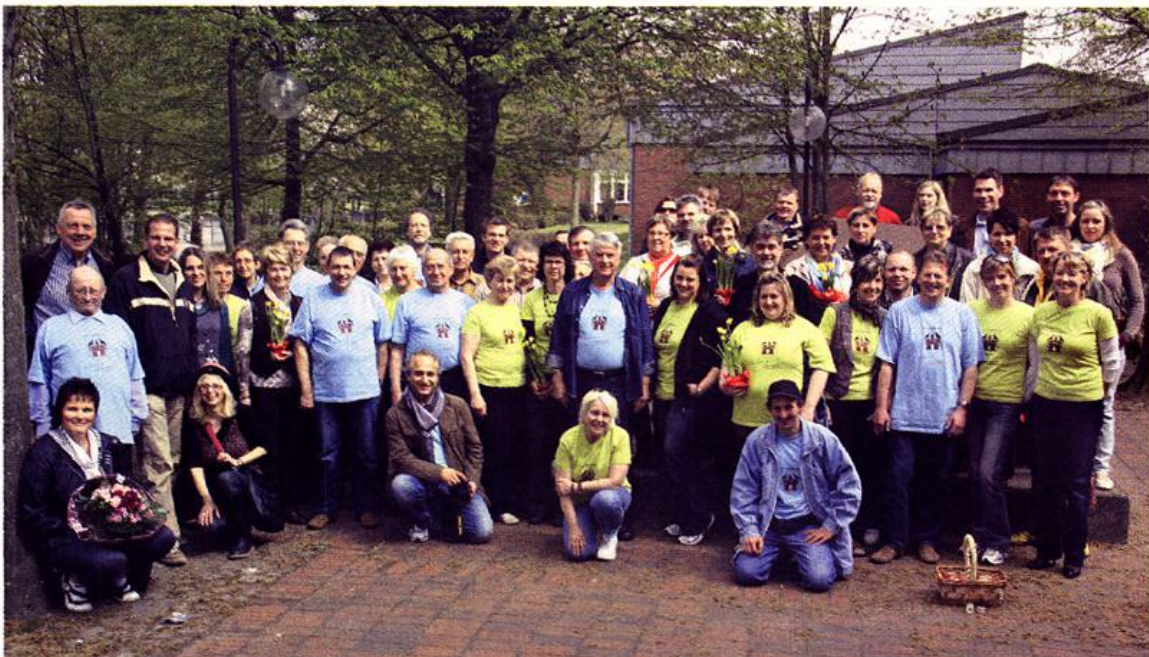
Rund 50 Wittenburgerinnen und Wittenburger besuchen die Stadt Lönigen im Rahmen der seit 1990 bestehenden Städtepartnerschaft.