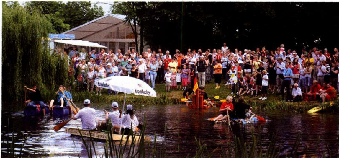
Cappeler Mittsommernacht: Bootsrennen auf dem Dorfteich

04. 07. Die Kirmes in Cappeln wird erstmals als „Cappeler Mitsommernachtsfest“ auf dem Dorfplatz gefeiert