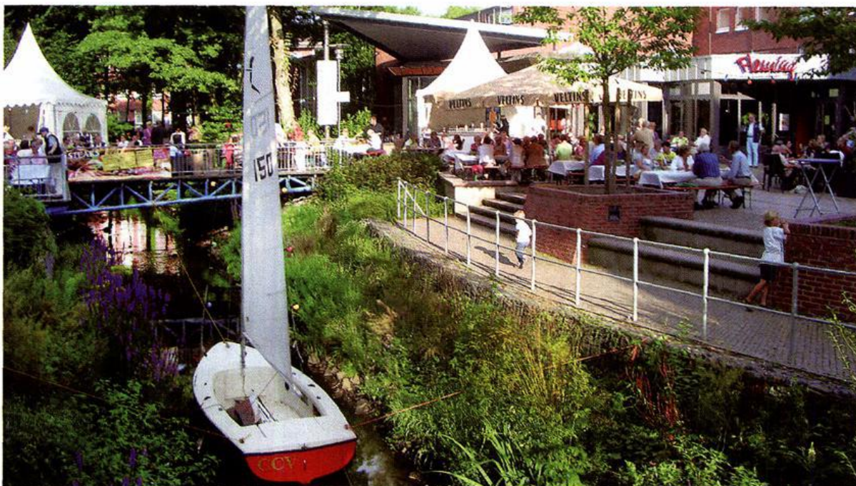
1. Cloppenburger Hafenfest auf dem neu gestalteten Vorplatz der Stadthalle