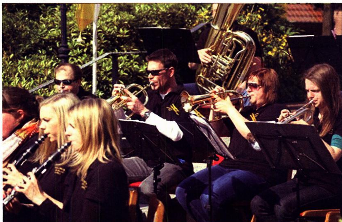
In Lönninge spielt die Musik – hier beim 10. Remmers Hasetal-Marathon, dem überregionalen Lauffest.