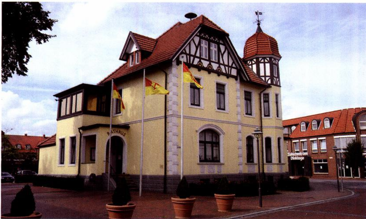
Das Rathaus der Stadt Dinklage, im Hintergrund das neue „Zahnzentrum“