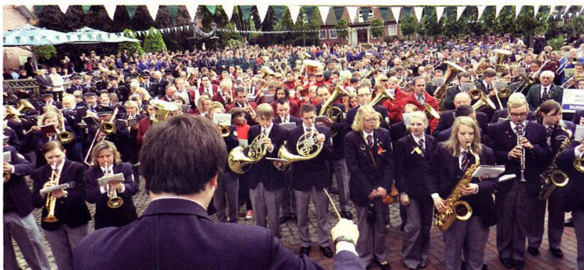
Mehr als 1000 Musiker versammelten sich nach einem kurzen Sternmarsch auf dem Linderner Marktplatz zum Auftakt des 63. Kreismusikfestes.