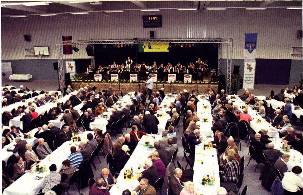
Ein Großereignis in der Gemeinde Lastrup war die Ausrichtung des Münsterlandtages am 05.11.2011.