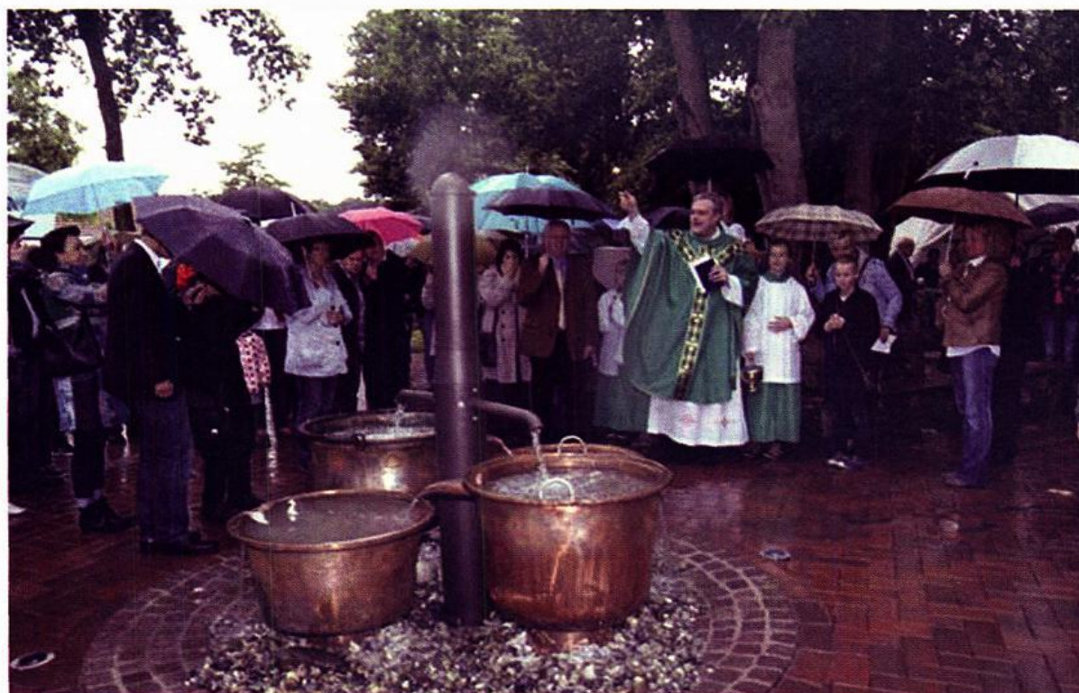
Der neue Dorfbrunnen in Lüsche

15. 07. Einweihung des „Dorfbrunnens“ in Lüsche anlässlich der Lüscher Kirmes