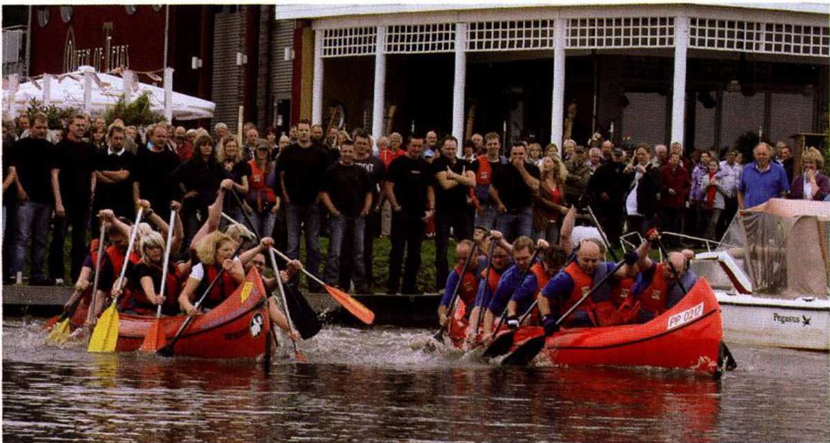
Kanu-Regatta beim Barßeler Hafenfest