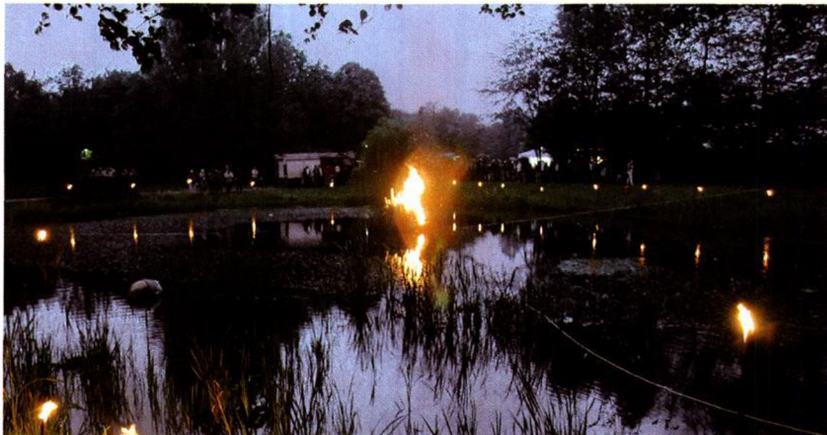
Mittsommernachtsfeuer auf dem Dorfteich