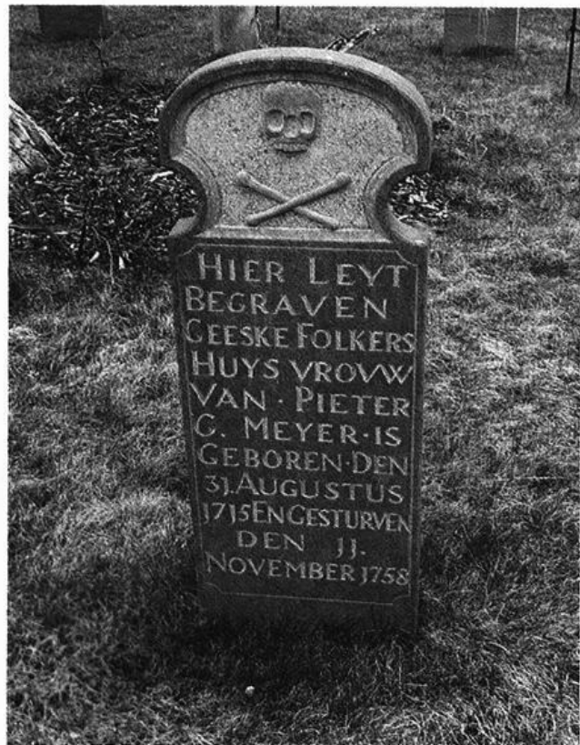
Inselfriedhof am alten Leuchtturm auf Borkum

Wo moje us Öllerngraff hier achtern hoogen Diek ligg.