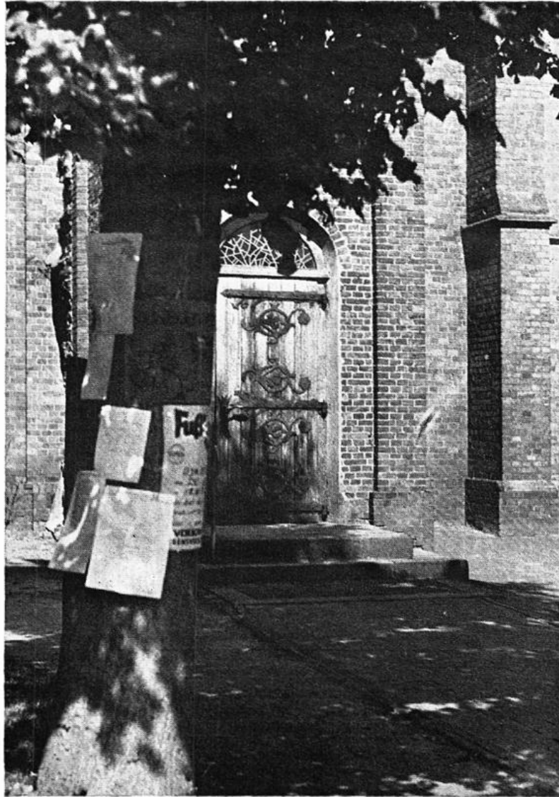
Buntvull hangt jeden Sönndag in Elsten der Boom bi de Karken

Ower nich alles dröft man jedertied an dissen Boom anbringen. Vör dat Konzil wer noch an väle Stäen baoben an'n Boom eine Holttaofel anbraocht, dorup stünd van'n Pastor unnerschräwen, dat't verbaoden was, Mitteilungen van Danz oder ännere Lustbaorkeiten hier antauschlaon. De Boom bi de Karken wer und is äben ein besünneren Boom — so'n bäten van de Hilligkeit van de Karken ligg up üm.