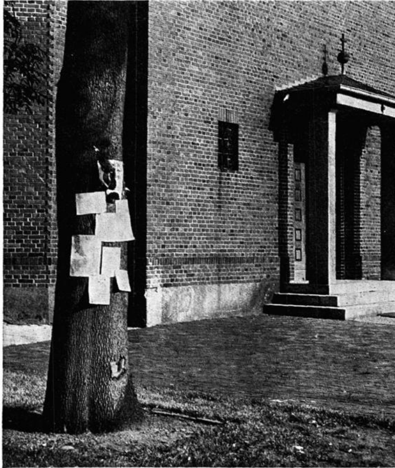
Dicht bi de Karkdörn steiht disse Eiken in Markhusen