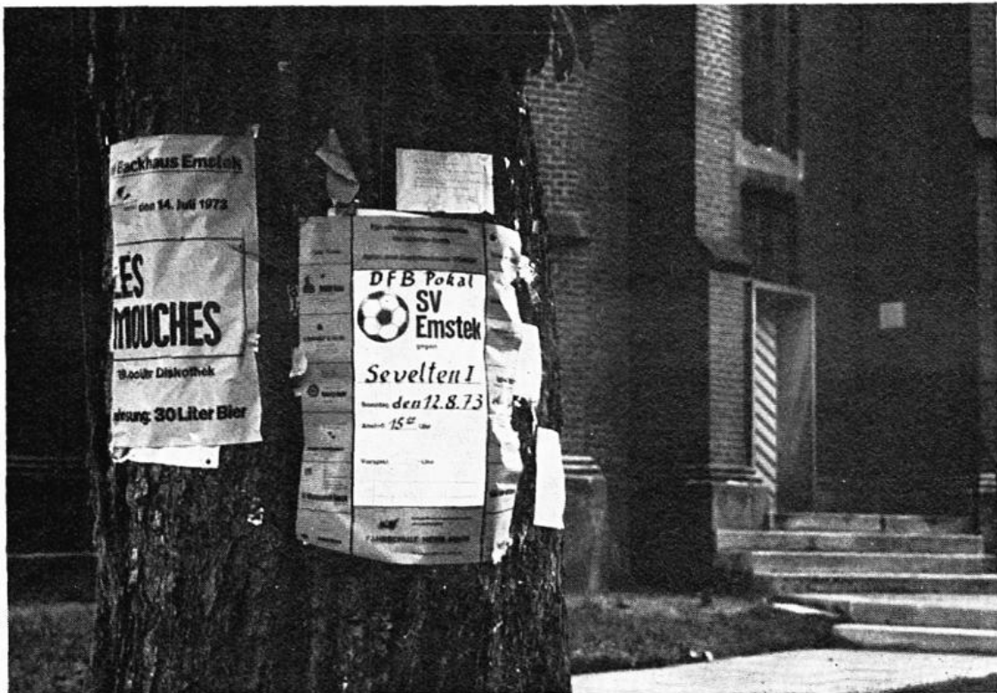
Wat vandoage de „Littaßsäule“ inne Stadt bedütt, dat is siet hunnert un mehr Joahren de Boom bi de Karken Use Bild wiest den dicken Boom bi St. Margarethen in Emstek