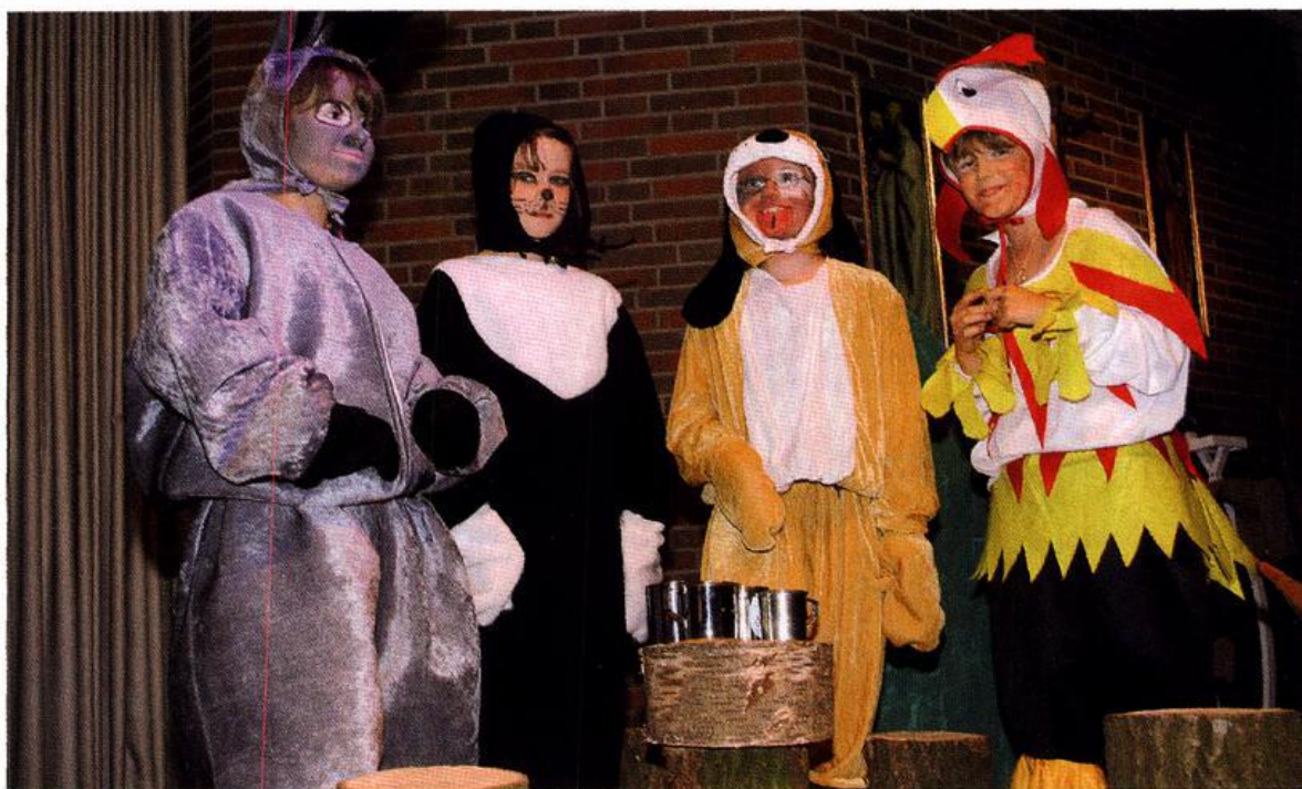
Bild vom Musical „Die Bremer Stadtmusikanten“ auf den Garreler Kulturtagen 2012

11. 07. „Der Dorfpark brennt“: Diese Parole hatte der Kunst- und Kulturkreis Garrel für das letzte Sommerferien-Wochenende ausgegeben. Es standen die inzwischen sechsten Garreler Kulturtage auf dem Programm