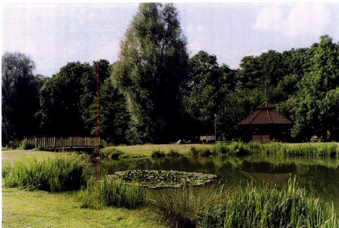
Der Dorfplatz in Cappeln

Einwohner: 6.729 (Zensus: 6.908); Geburten: 58; Sterbefälle: 51; Saldo: + 7; Zugezogene: 3.403; Fortgezogene: 3445; Saldo: - 42; Bevölkerungsbilanz: - 35