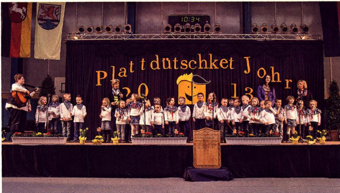
Kinder aus dem Kindergarten St. Anna, Peheim, mit ihren Erzieherinnen bei ihrem Auftritt (Singspiel) in der Auftaktveranstaltung zum Plattdeutschen Jahr in der festlich geschmückten Dreifeld-Sporthalle