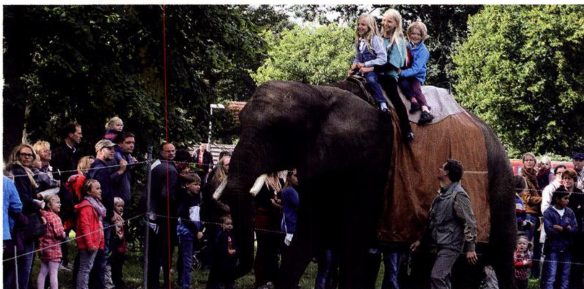
Der Besuch der Elefantendame „Bumba“ war einer der Höhepunkte beim Familientag