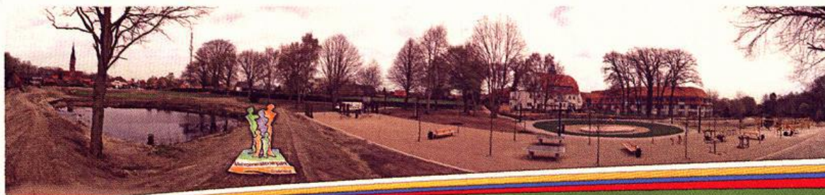
Der neue Mehrgenerationenpark im Goldenstedter Ortskern