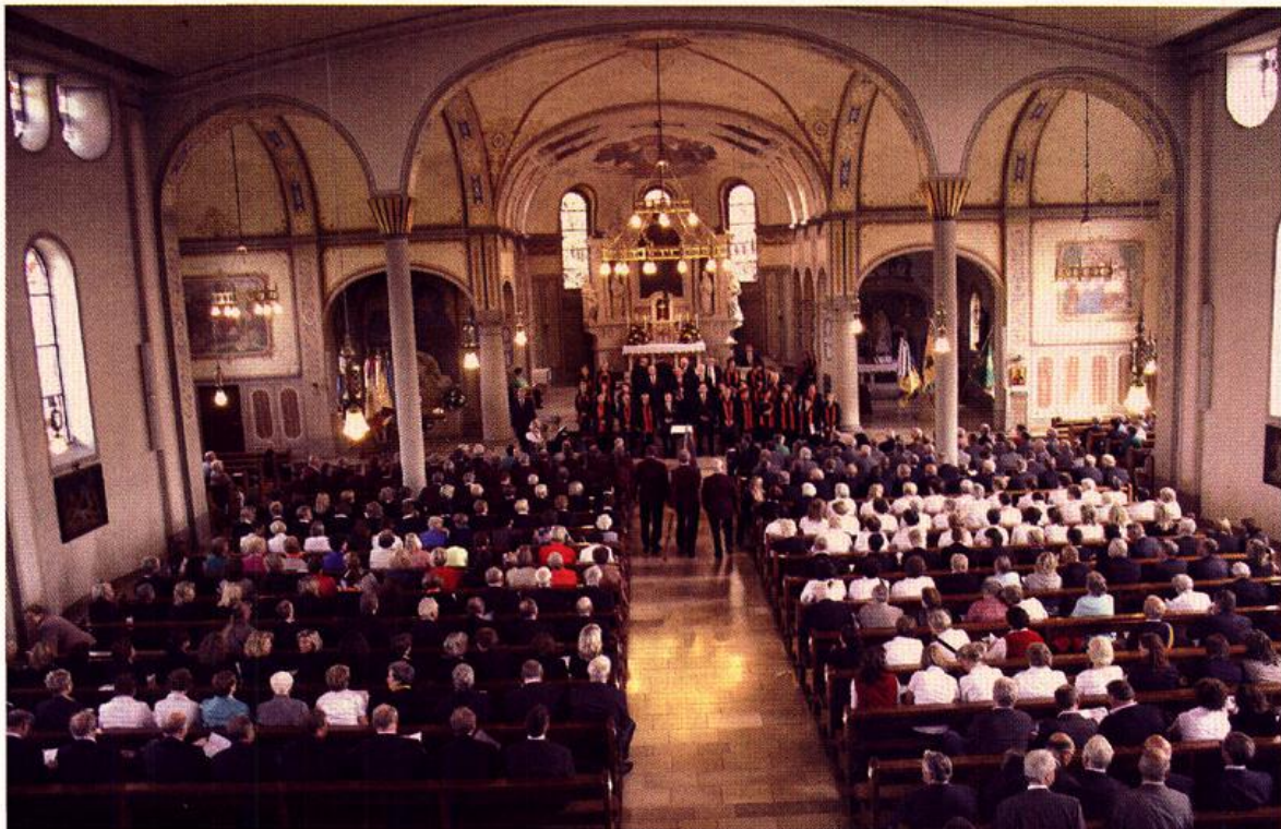
81. Bundeschorfest des Sängerbundes „Concordia“. Konzert in der Kath. Kirche St. Cäcilia Bösel