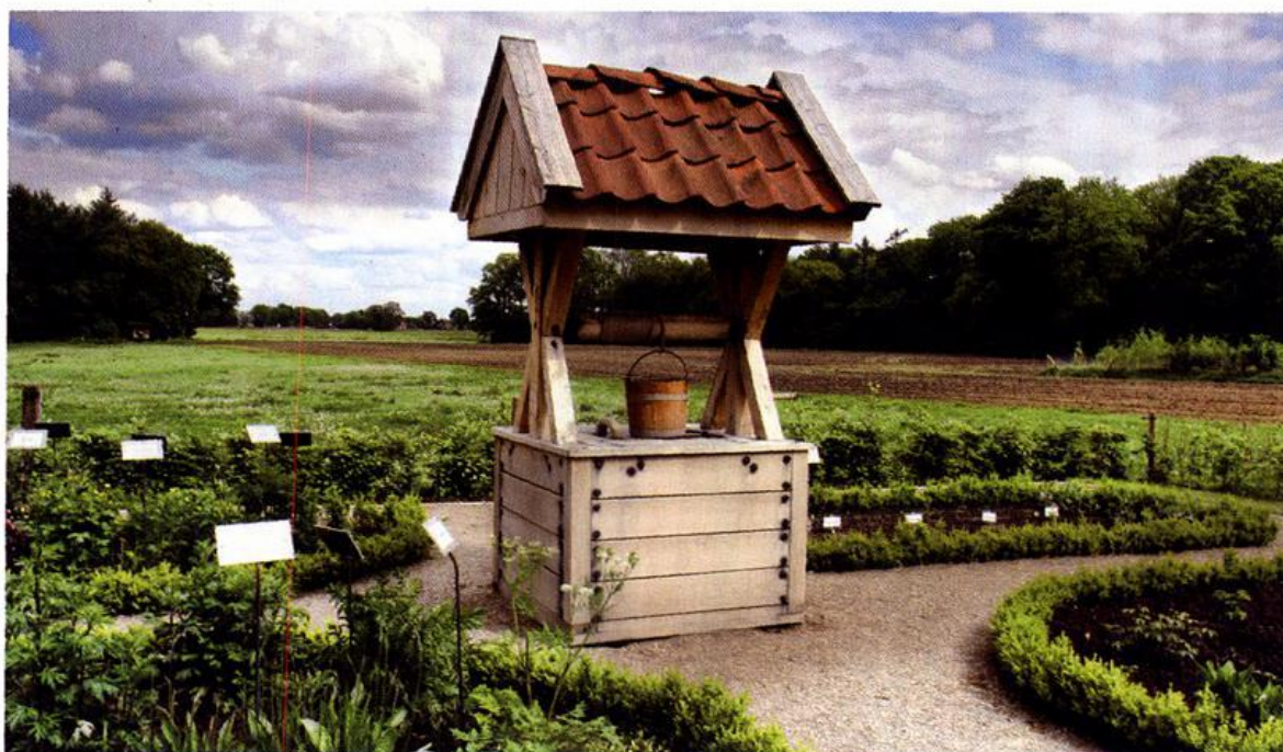
Der historische Brunnen im Klostergarten Bokelesch