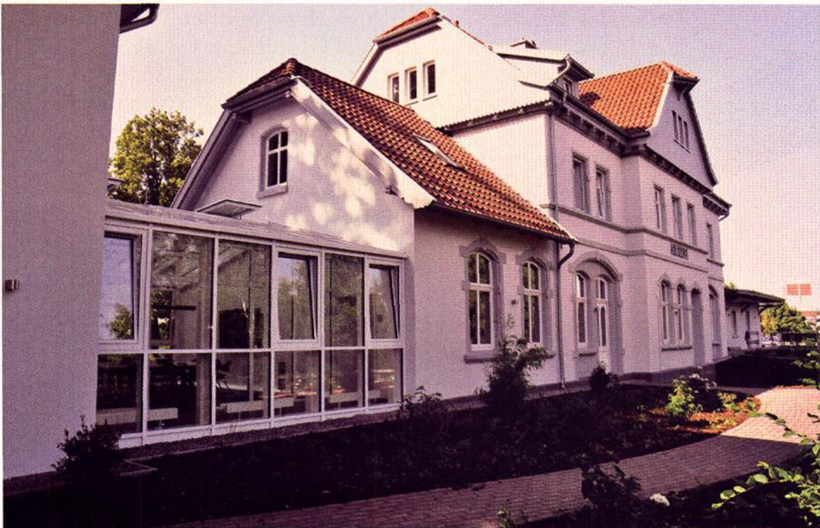
Der frisch sanierte Holdorfer Bahnhof