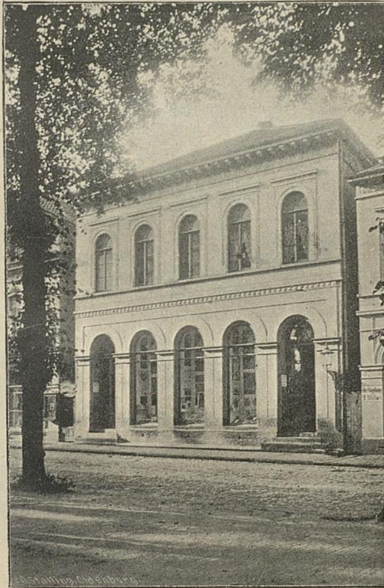
Schulzefche Hof-Buchhandlung und Hof-Buchdruckerei. A. Schwarz.