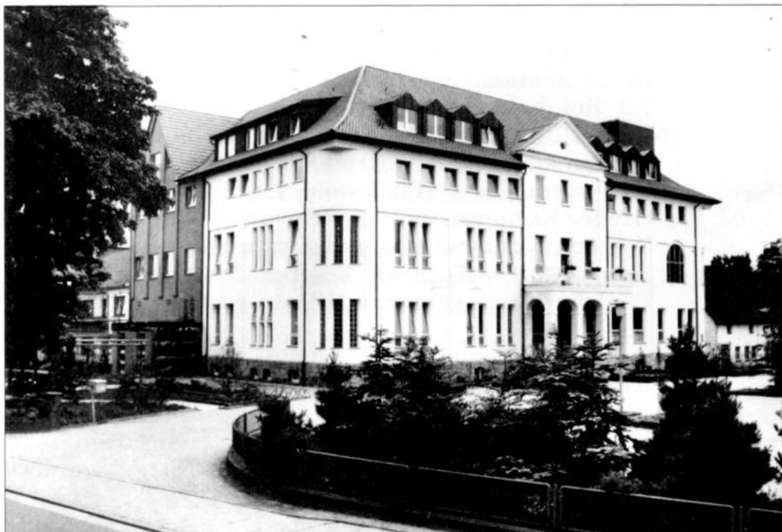
St. Elisabeth-Stift, Lastrup