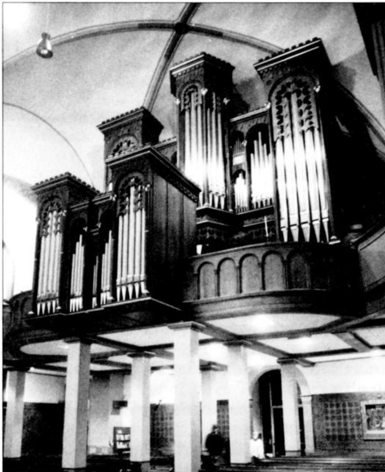
Neue Orgel in St. Gertrud, Lohne