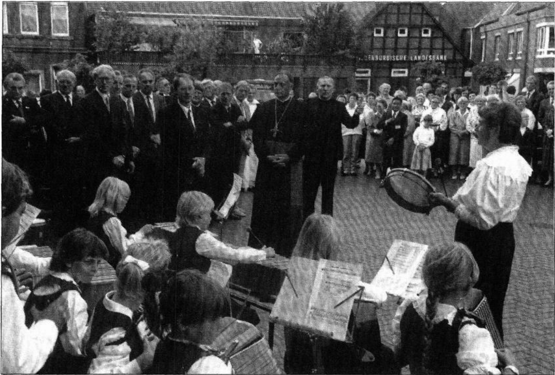
Zur Eröffnung der Festwoche „800 Jahre Steinfeld“ feiert Bischof Reinhard Lettmann ein Pontifikalamt. Die Musikgruppe Steinfeld bringt dem Bischof anschließend ein Ständchen.