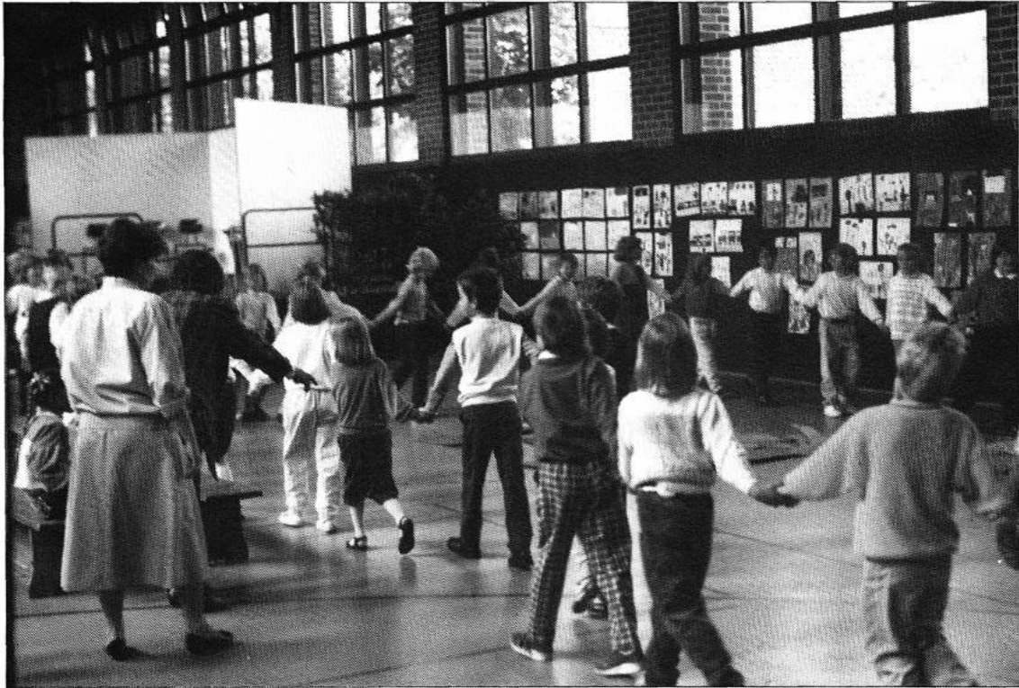
Schulkinder beim Einzug in die Turnhalle während des Festaktes.