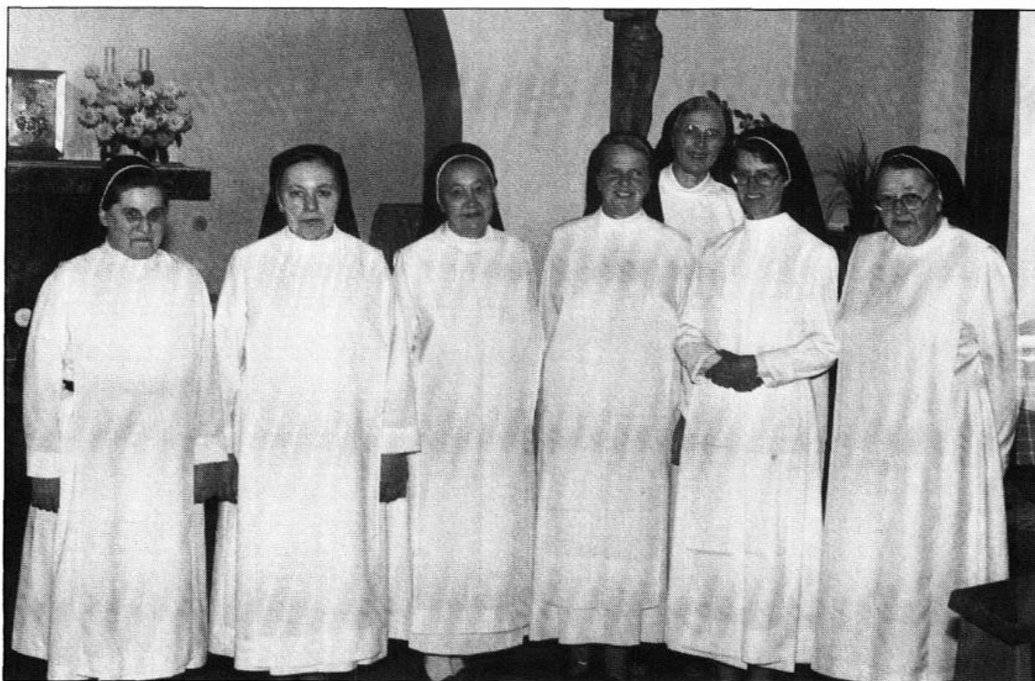
Missionsdominikanerinnen im Kloster St. Jordan