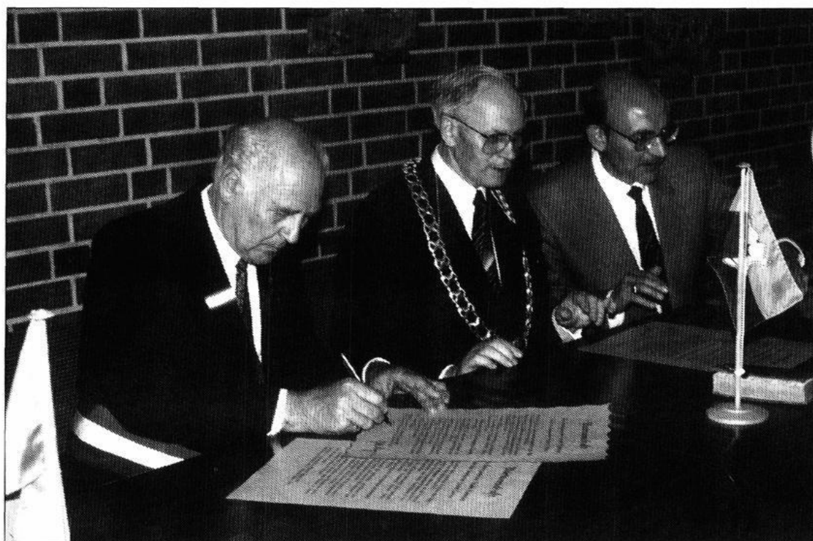
Unterzeichnung der Partnerschaftsurkunde am 3. Mai 1987